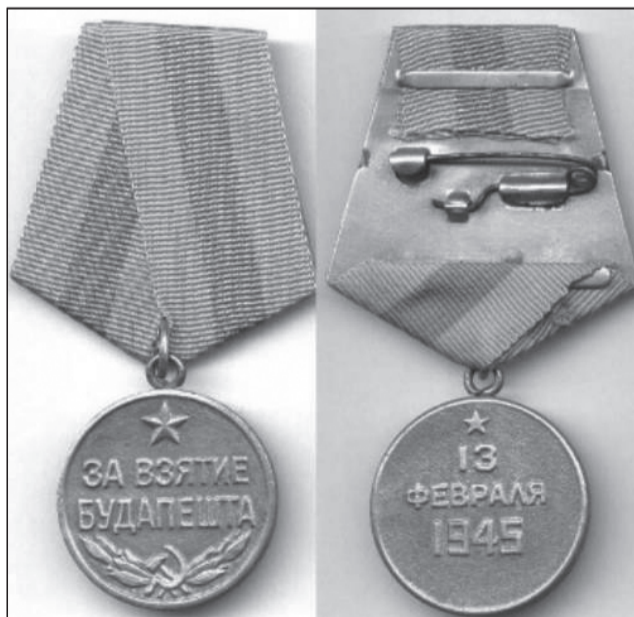
Третьим городом, за взятие которого в СССР была учреждена медаль, стала венгерская столица Будапешт – последний европейский сателлит Гитлера.