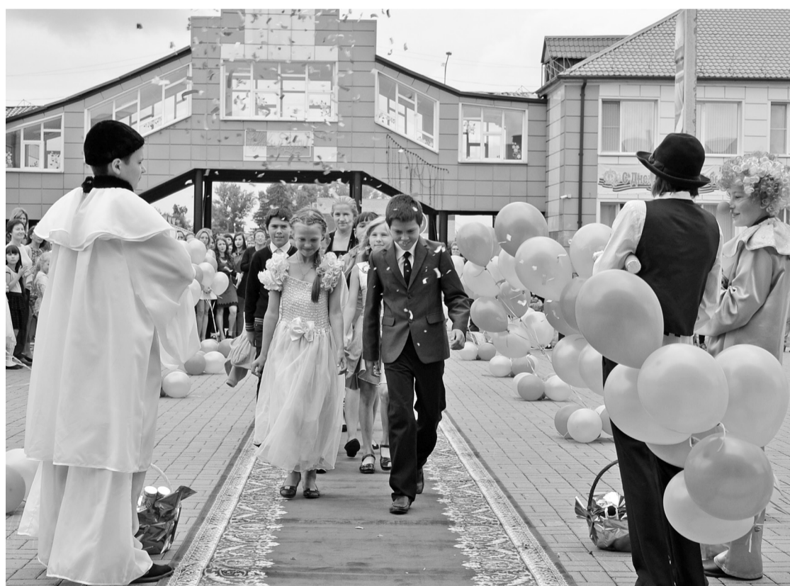
На красной дорожке – участники первого районного кинофестиваля.