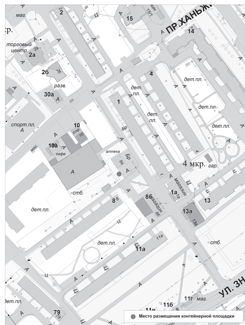
Схема размещения контейнерной площадки по адресу: Тюменская область, г.Тобольск, 4 мкр., стр.8а М 1:1500

Приложение: Схема размещения контейнерной площадки - на 1 л