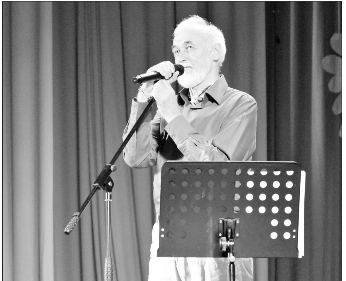
Новая концертная программа Фролова-Крымского включала в себя стихи и песни, видеосюжеты и реальные истории.

В ходе концерта также состоялось передача тематической литературы в пользование Нижнетавдинской Центральной районной библиотеки и церемония награждения: медали «Юный патриот России» были вручены воспитанникам кадетского класса «Русские витязи». Людям, активно занимающимся патриотическим воспитанием молодёжи, были также вручены благодарственные письма совета Общественной организации ветеранов военной контрразведки.