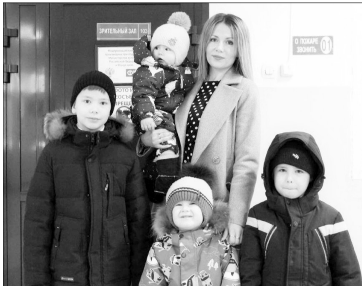
☑ Сегодня для многодетных семей существуют разные формы поддержки по линии соцзащиты, начиная от регионального материнского (семейного) капитала и заканчивая большим списком пособий и льгот.

выплата на третьего ребёнка и последующих детей, рождённых не позднее 31.12.2022 года, если среднедушевой доход ниже двух прожиточных минимумов для трудоспособного населения, то есть менее 33 688 руб. на человека. Начисляется до трёх лет. Данный вид помощи можно оформить как в соцзащите, так и в Социальном фонде.