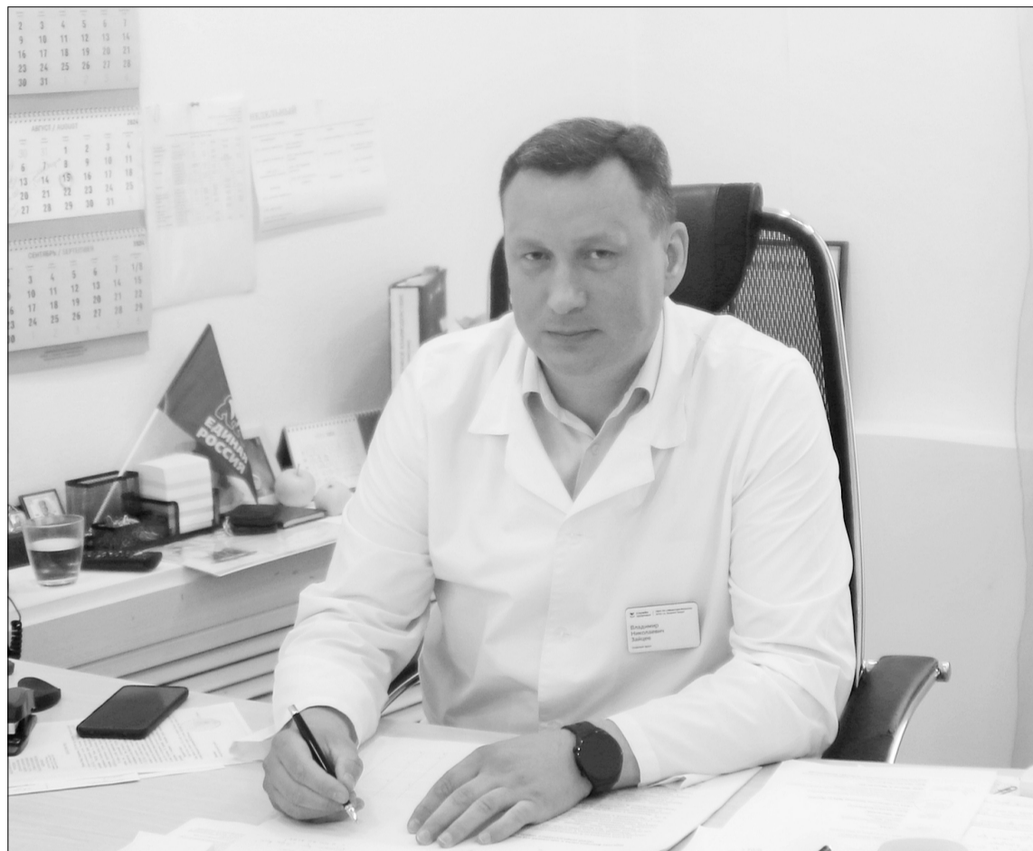
Владимир Николаевич рассказал о реализации национального проекта «Здравоохранение» в Нижнетавдинском районе.

Нужны два заведующих отделениями: педиатрическим (сейчас мы перекрываем это направление, привлекая педиатра из врачебной амбулатории) и акушерства и гинекологии. Специалист поменяла место жительства, и появилась вакансия. В боль-