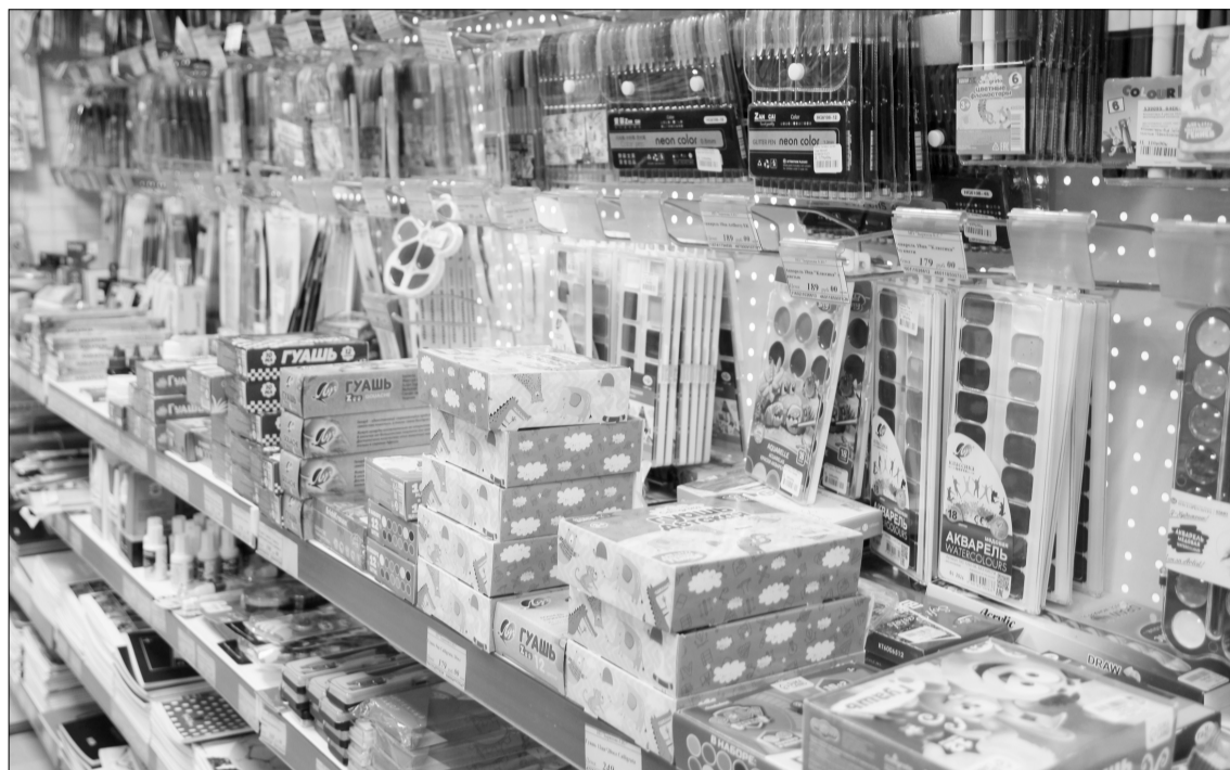
Август – месяц трат семейного бюджета на школьников.

Разумеется, подобная тенденция значительно влияет и на ценообразование: купить, например, школьный сарафан в августе – совсем не то же самое, что купить его в