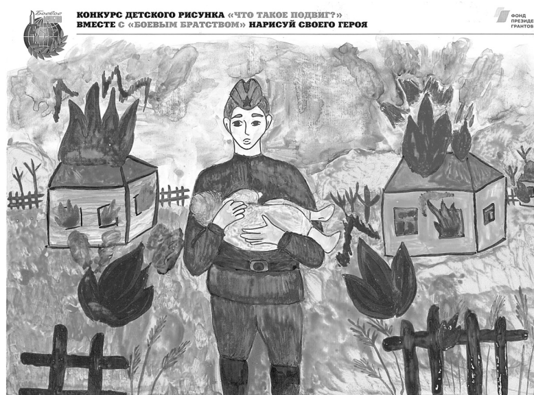
Рисунок Эдуарда Эйринга из Боровлянской школы

5 класса Малышенской школы, в сочинении задаётся вопросом: