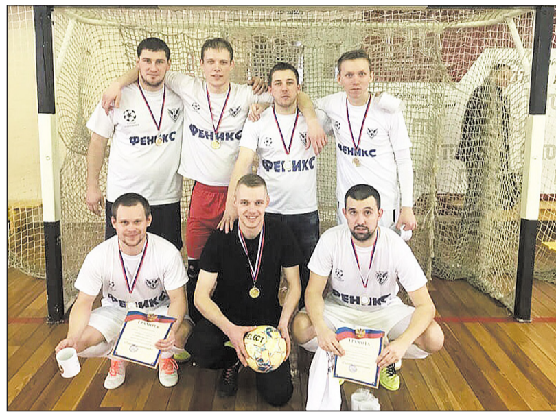
Команда «Феникс 92 – 95» в третий раз стала обладателем главного кубка соревнований

Спортсмены вступили в борьбу за главный приз «Турнира поколений»