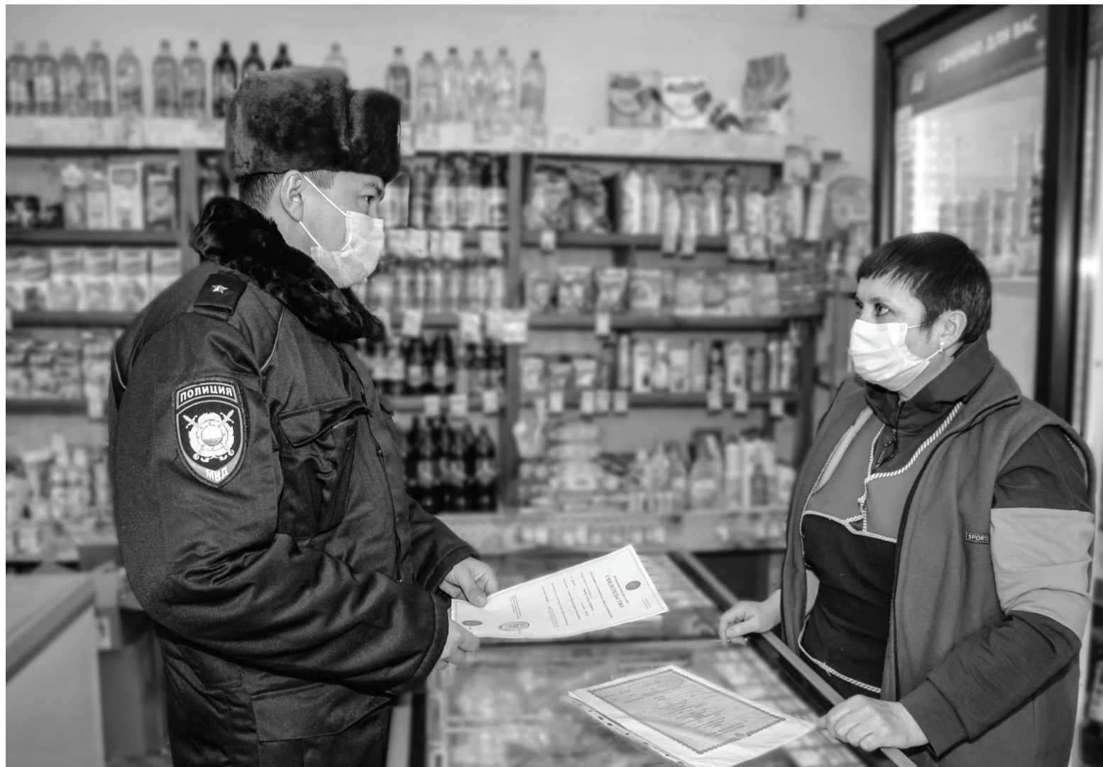
Полицейские проверяют документы на реализуемый алкоголь.