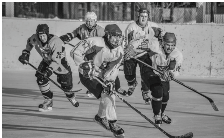
Сладковские хоккеисты обыграли казанских и заводоуковских спортсменов.

В период с 26 по 30 января сладковские спортсмены соревновались на спортивных объектах Тюменской области.