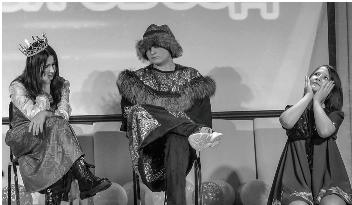
Творческие коллективы и солисты отчитались о работе в 2021 году.

В течение всего года работники учреждений культуры района ведут активную творческую деятельность. Для населения проводятся праздничные мероприятия, народные гуляния, развлекательные шоу-программы, концерты и многое другое.