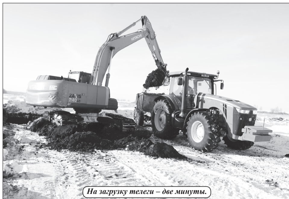
На загрузку телеги – две минуты.