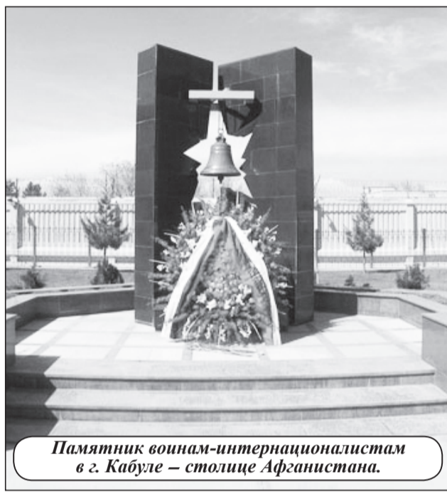
Памятник воинам-интернационалистам в г. Кабуле – столице Афганистана.

Воинам-афганцам сполна пришлось хлебнуть и страданий, и горя, и отчаянья, и трудностей. «Душманы» воевали как партизаны, и советским войскам потребовалось много времени, чтобы научиться противостоять вражеской тактике. По факту, долгие годы наши парни воевали за непопятные межнациональные и межклановые противостояния в чужой стране. При этом население СССР практически ничего не