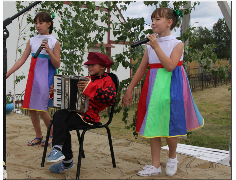
• Песня «Гармонист Тимошка» в исполнении вокальной группы «Улыбка» вызвал бурю оваций.

На территории немало сельчан, которые приносят славу малой родине своими спортивными достижениями. На цере-