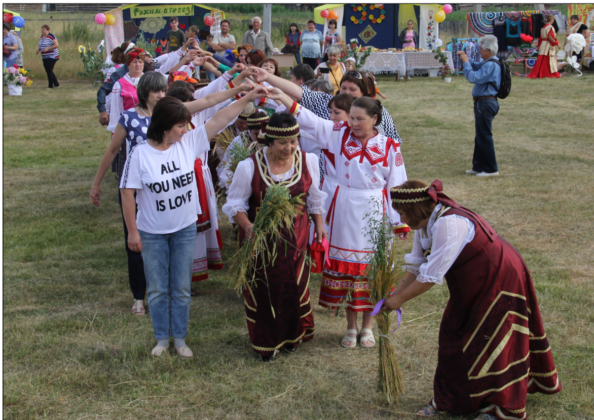
• Участники праздника выносят снопы через «ручей», чтобы собрать суслон.

С утра и до самого вечера село пело, плясало, веселилось. Праздник получился какой-то особенный, светлый, добрый, наполненный духом старины, и он пришёл всем по душе.