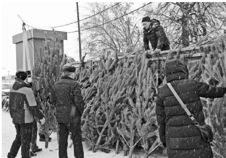
➤ Фото Татьяны СУХОВОЙ