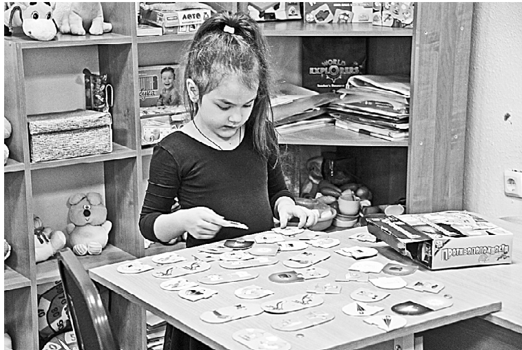
» На занятиях по подготовке к школе

В 2016 году в Викулово открылся Центр образования и туризма «Альфа». У детей (да и у всех желающих взрослых) появилась возможность изучать английский язык. Для многих школьников, у кого «провисают» знания языка, есть шанс «понять» предмет, а для некоторых английский стал и хобби, и неотъемлемой частью жизни. Здесь, играя, учатся говорить. Почему «играя»? Потому что методики обучения, хоть и перекликаются со школьной программой, но другие: «замешаны» на игре и интересе.