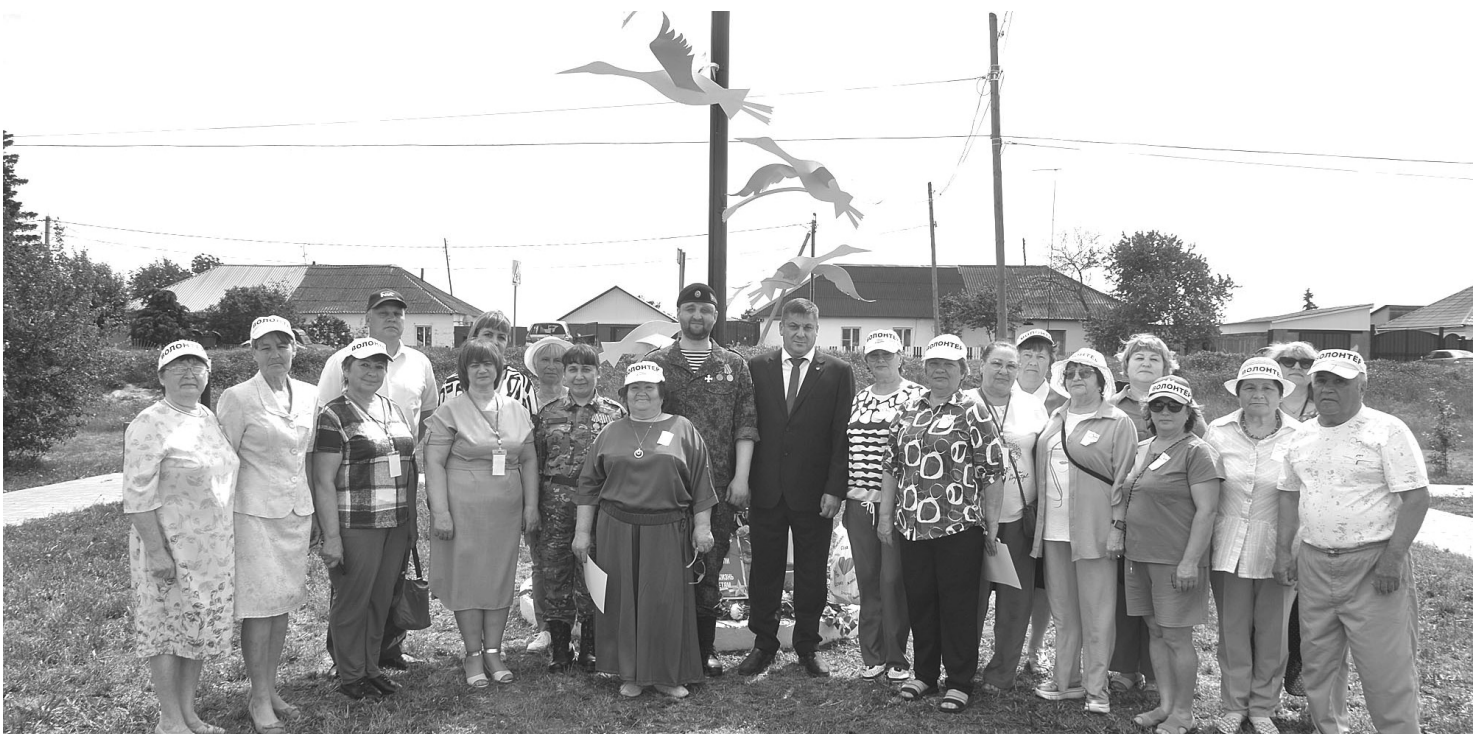
Открытие стелы стало значимым событием для всех жителей села