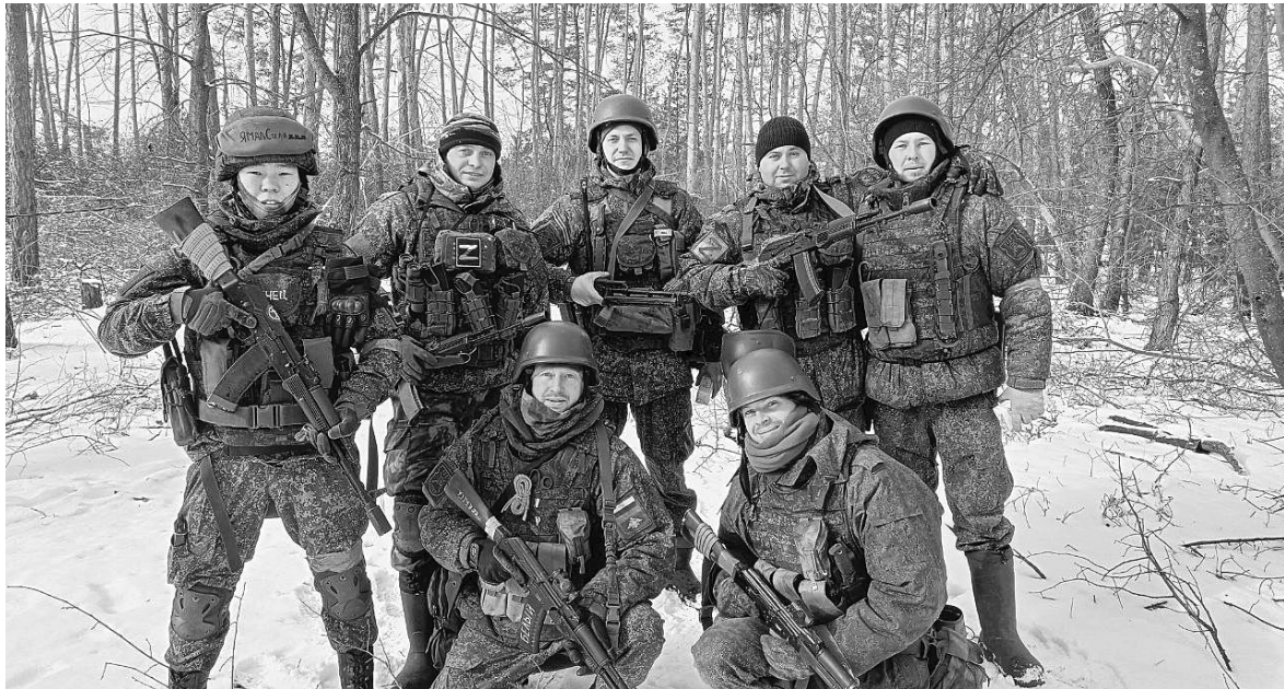
На одном из боевых заданий