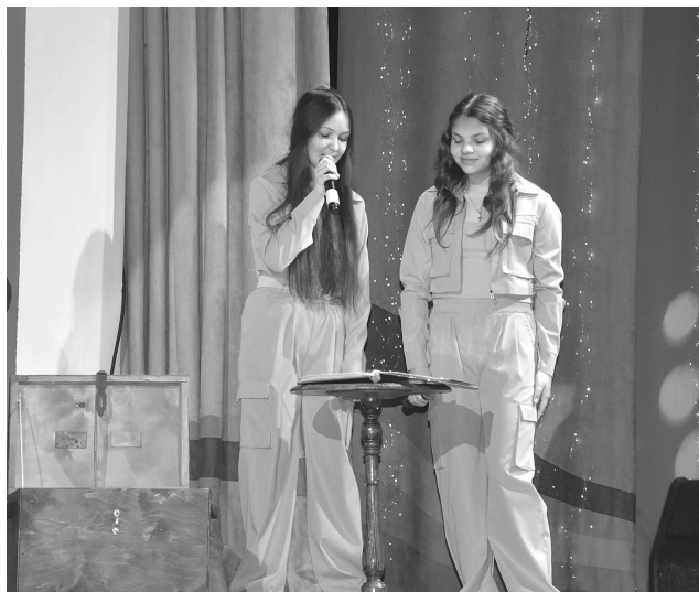
Яркие вокальные номера воспитанников студий стали украшением праздничного концерта