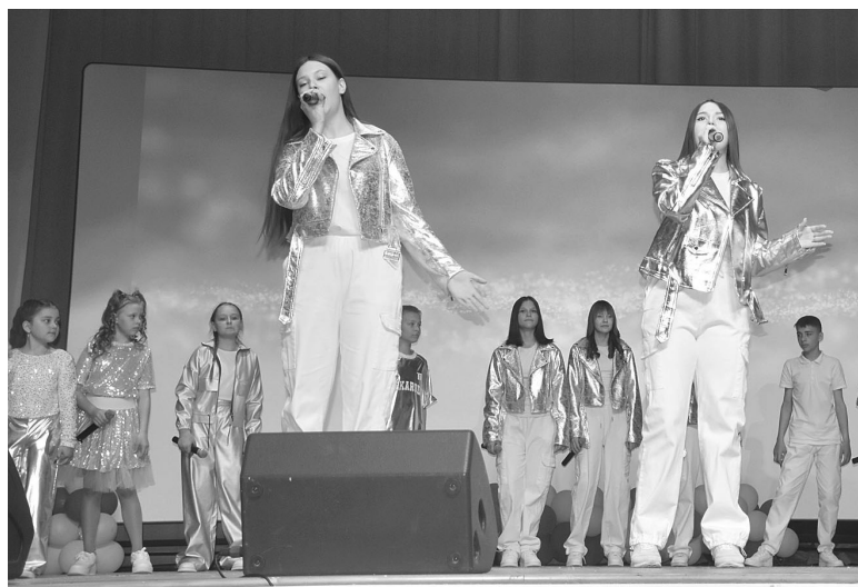
На празднике звучали песни в исполнении дуэтов и коллективов студий

ности воспитанники вокальных студий принимали активное участие в фестивалях, конкурсах и концертах, украшая их своими музыкальными выступлениями.