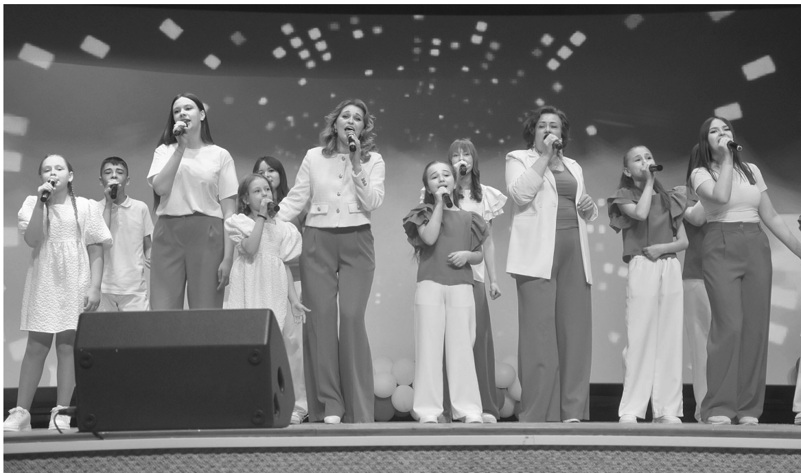
Вокальные студии ярко и незабываемо отметили свои юбилей

профессионально, становятся с каждым разом выше по уровню исполнительского уровня и умению держаться на сцене. Конечно, в этом заслуга наставников ребят – руководителей студий, которые, не считаясь с личным временем, работают с ребятами и отдают им свои сердца.