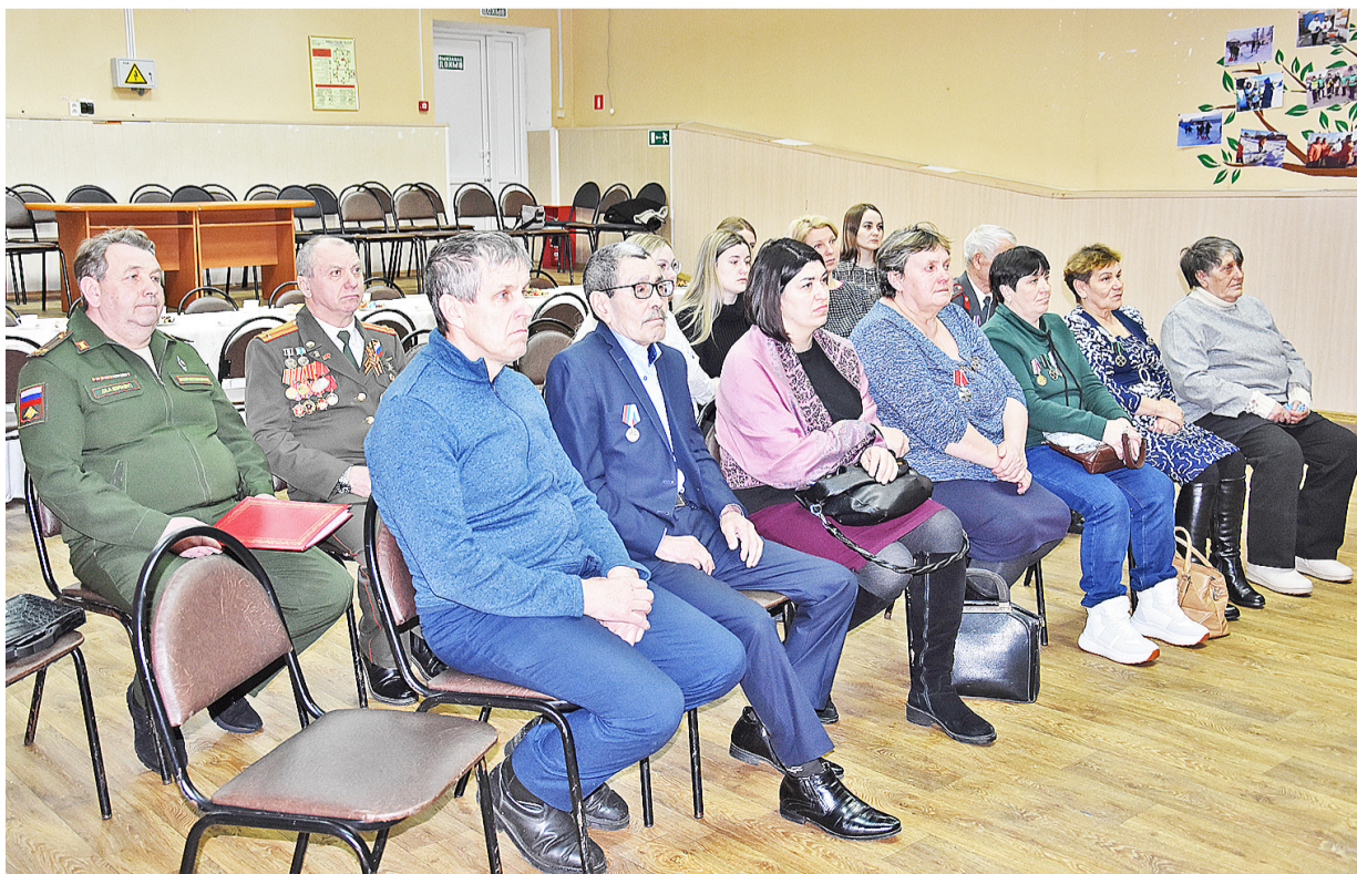
Родные и близкие земляков, погибших в ходе спецоперации