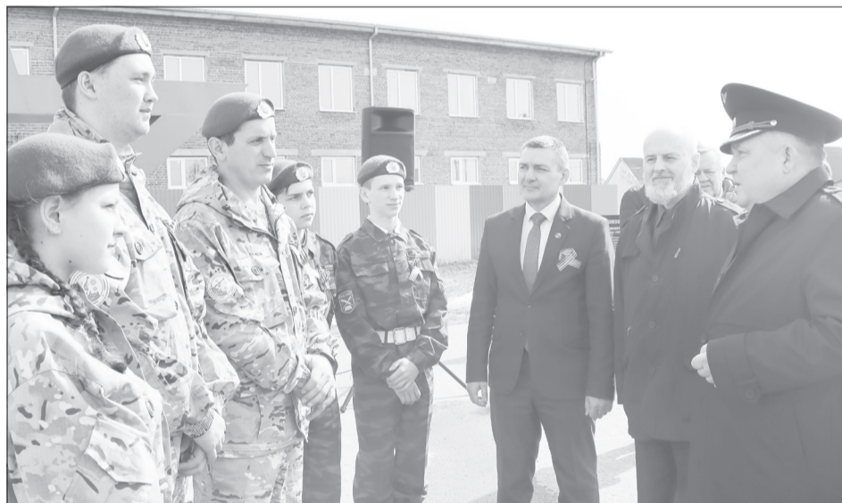
Из района на «Вахту Памяти - 2022» отправились новички

В Новгородской области сводный отряд Тюменской области с 1989 года участвовал в поисках в районе деревень Мясной Бор, Малое Замощье, Спасская Полисть, Кречно и Вдицко