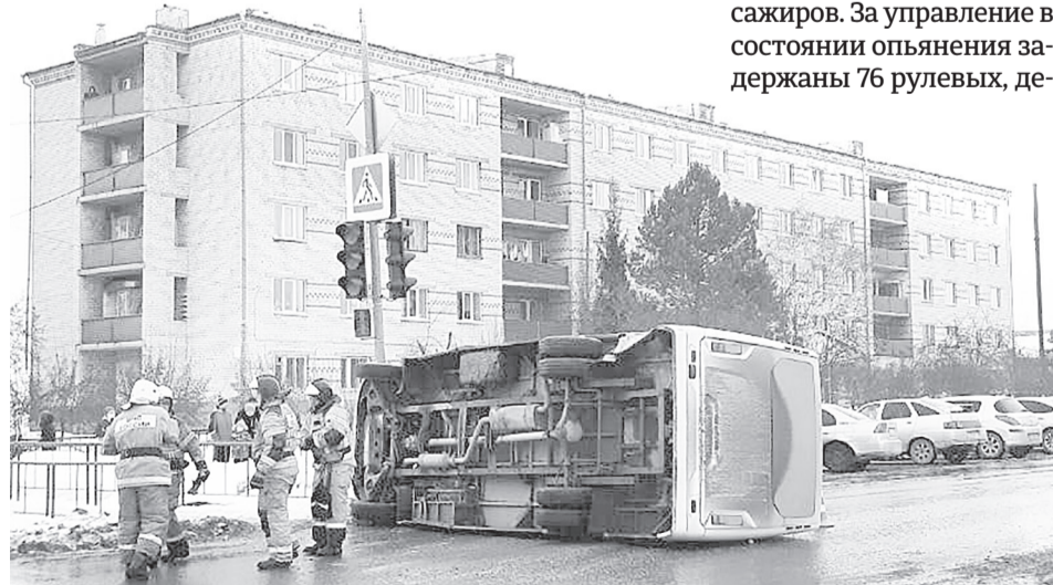
Аварии с общественным транспортом устроил водитель УАЗа, нарушив очередность проезда перекрёстка

На постоянной основе инспекторы ГИБДД проводят профилактику с водителями, перевозящими детей. За нарушение правил перевозки к административной ответственности привлечены 122 автомобилиста.