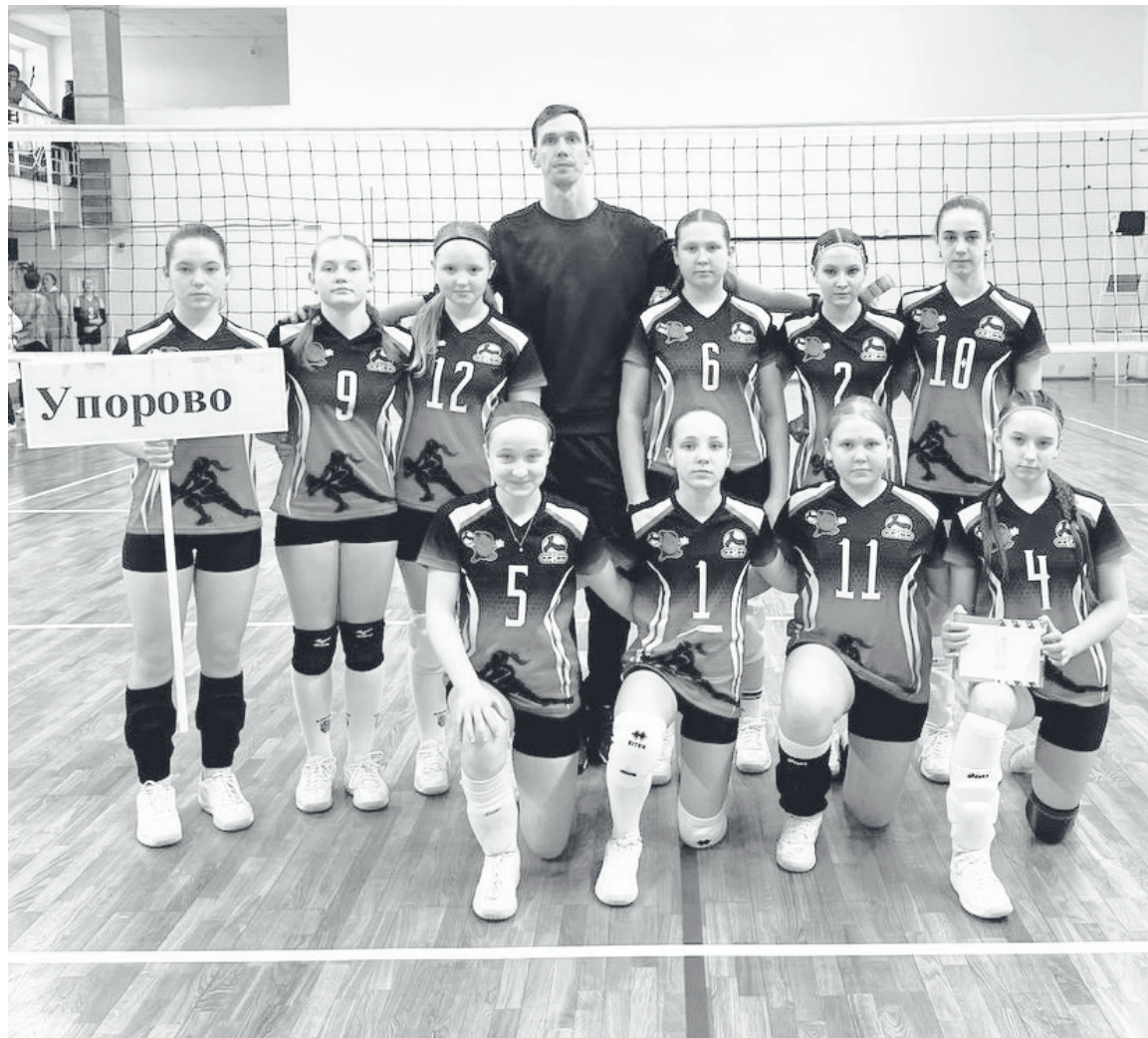
Команда девушек 2012-2013 г. р. заняла III место в Первенстве России в г. Челябинске, зона УрФО.