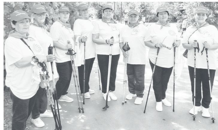
К соревнованиям упоровские пенсионеры всегда готовы.