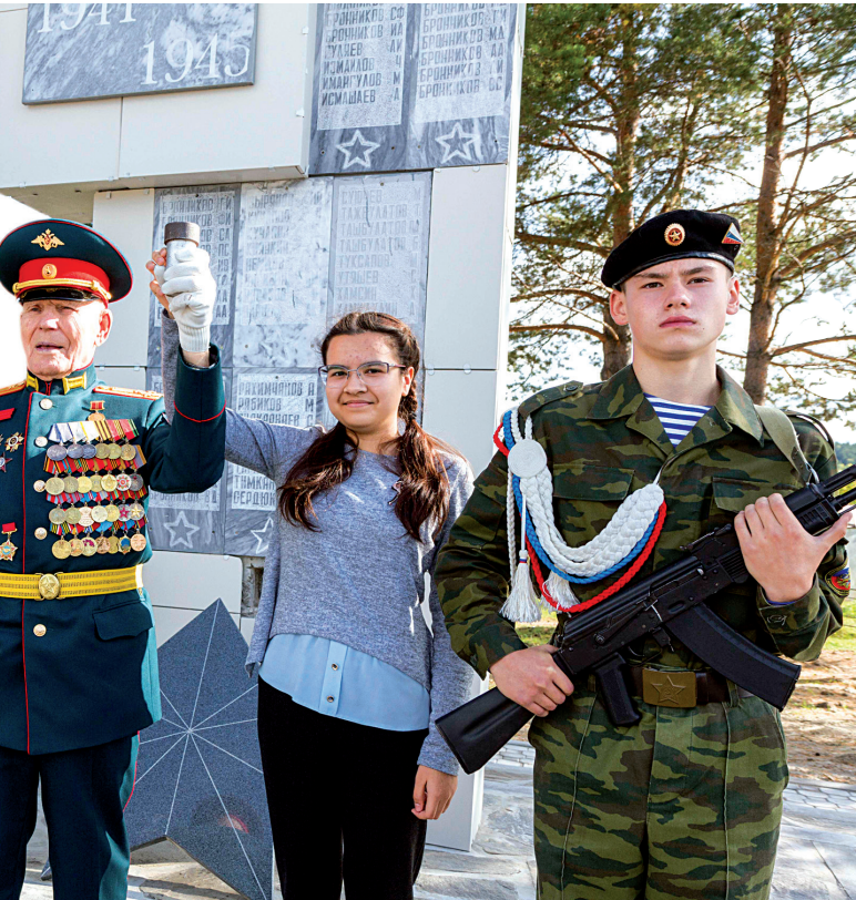
📷 От фронтовика на память

Помните о людях, которые защищали нашу державу. Друзья мои, идёте время, а вместе с ним движется наша страна. И я убеждён, что через двадцать пять лет, когда вы будете отмечать 100-летие