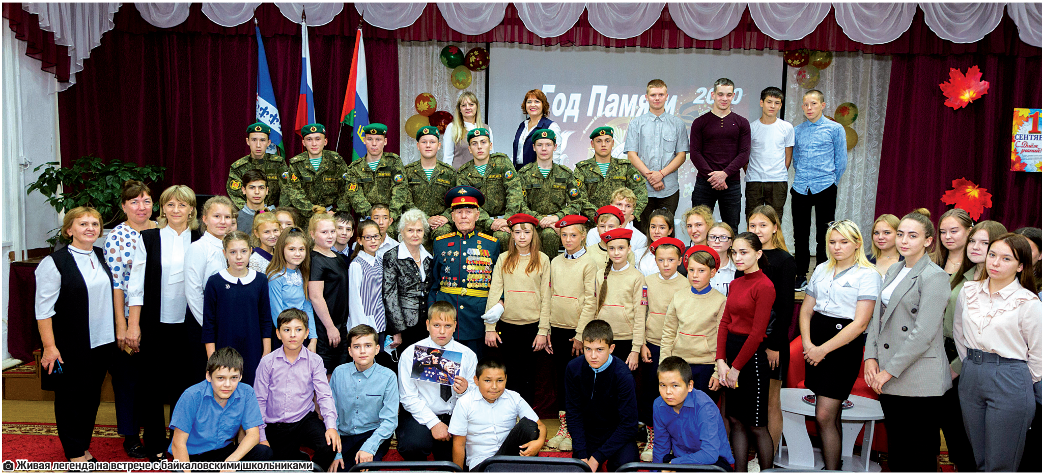
Живая легенда на встрече с байкаловскими школьниками