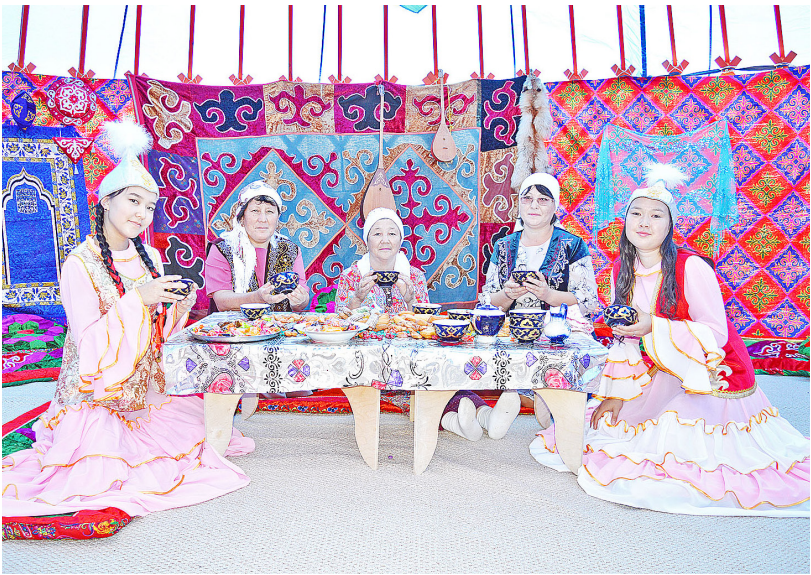
Радушно встречали гостей на казахском подворье

слушала их песни, многие танцевали под живую музыку.