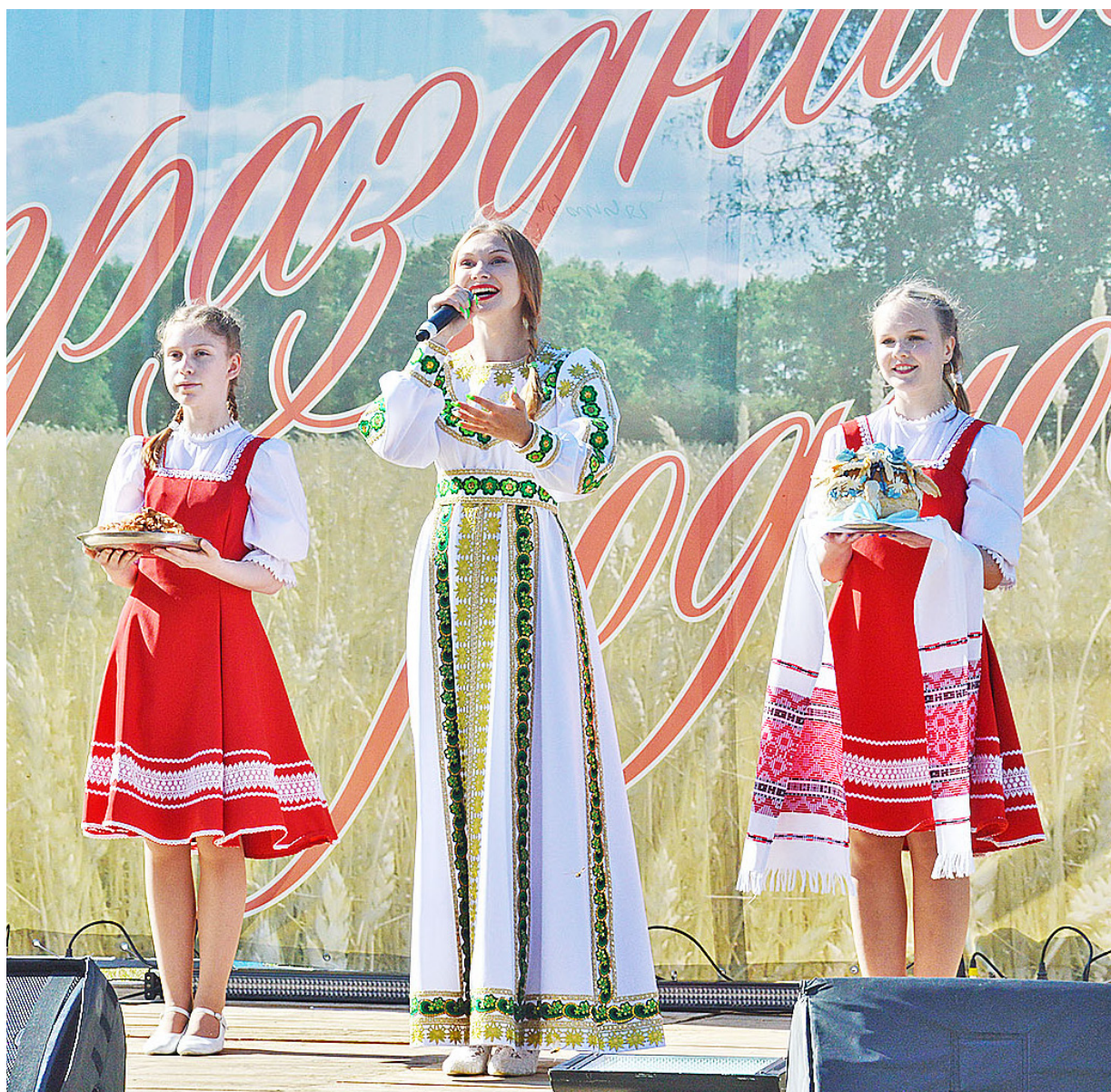
День образования Тюменской области – праздник для всех её жителей

Широка и привольна тюменская земля. На её территории проживают представители свыше 140 национальностей, в том числе в Казанском районе – более двадцати. Все они живут в мире и согласии, поддерживая добрососедские отношения.