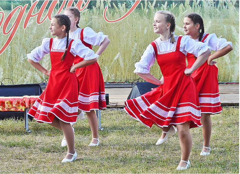
Детский танцевальный ансамбль «Многообразие» Казанского РДК

Дефиле в национальных костюмах стало восхитительным зрелищем. Все участницы выглядели великолепно: яркие колоритные наряды подчёркивали их индивидуальность. В испытании «Визитка» участницы рассказали о себе, о стране, где компактно проживает нация, которую они представляют, о её легендах и традициях. Последним заданием, которое оценивало жюри, был творческий номер. Никто из красавиц в этом конкурсе не остался без внимания. Каждая участница получила оценку в какой-либо номинации. Главную номинацию «Народное до-