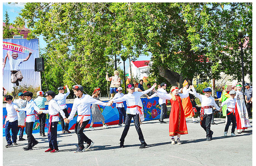
Детский хоровод – украшение любого праздника

Ярко и динамично выступали дети с другими танцевальными номерами. Ребята из отряда «Родничок» Новоселёвской школы показали белорусский танец, а из отряда «Созвездие», созданного на базе детской школы искусств, – немецкий. Забавной была песенка про картошку, сопровождающаяся игрой на расписных деревянных ложках, которую исполнили румяные девчата одного из отрядов Казанской школы, умиленье вызвала инсценировка «Жили у бабуси два весёлых гуся», подготовленная ребятами из центра развития детей.