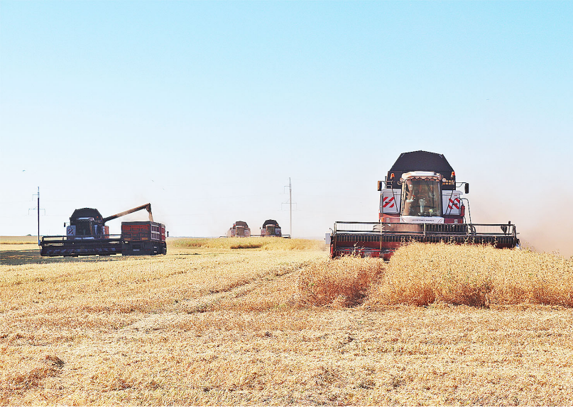
Аграрии Казанского района набирают высокие темпы полевых работ

За первую половину августа аграрии региона обмолотили 27000 гектаров посевных площадей или 4 процента при средней урожайности 27 центнеров с гектара. Годом ранее труженики полей на тот момент убрали 30 тысяч гектаров при урожайности 14 ц/га, а в 2020 году ситуация выглядела так: 21 процент (141 тыс. га) обмолоченных площадей при урожайности 21 ц/га. В числе первых по урожайности в текущем году можно выделить аграриев Аромашевского района – 41 ц/га, Исетского – 36 ц/га, Заводоуковского – 33 ц/га и Юргинского – 32 ц/га. Как отмечают эксперты, на старте уборочной кампании полеводы всегда демонстрируют высокое значение продуктивности полей, поскольку под обмолот могут попасть семенные участки и более урожайные посевы. К примеру, аграрии Упоровского, Ялуторовского и Казанского районов вышли на уборку раньше остальных, убрав более 2 процентов площадей, поэтому урожайность здесь стабилизировалась и колеблется в пределах 23–26 цент-