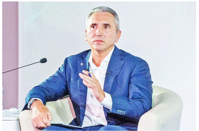
Александр Моор провёл пресс-конференцию, приуроченную ко Дню образования Тюменской области

Для будущих студентов планируется осуществить грандиозный проект – межвузовский кампус мирового уровня, где будет комфортно и начинающим учёным и преподавателям. В планах – возведение технопарка, футбольного поля, научных