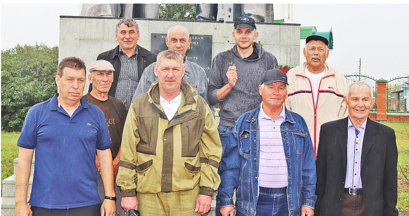
Служба в Вооружённых силах России сплочает и объединяет

На площади возле памятника Солдату и Матросу 12 августа прошла встреча ветеранов ВВС