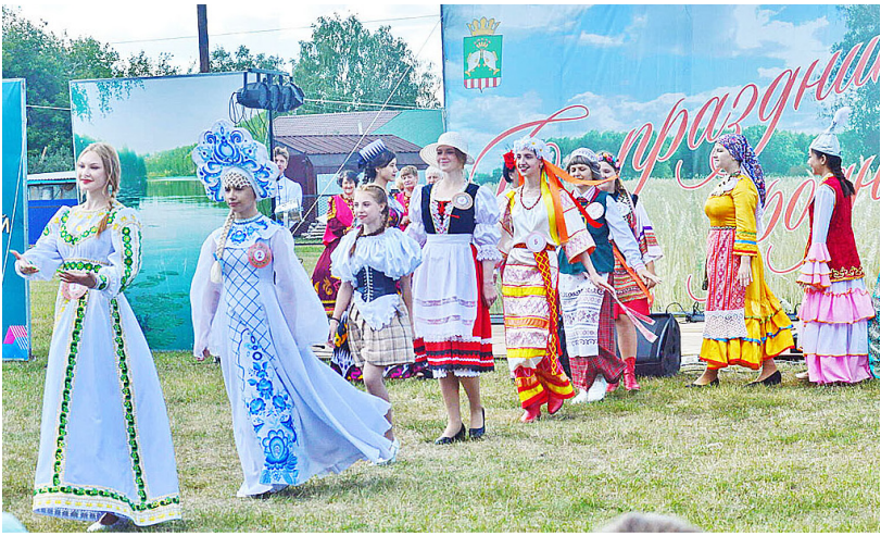
Участницы конкурса «Национальная красавица»