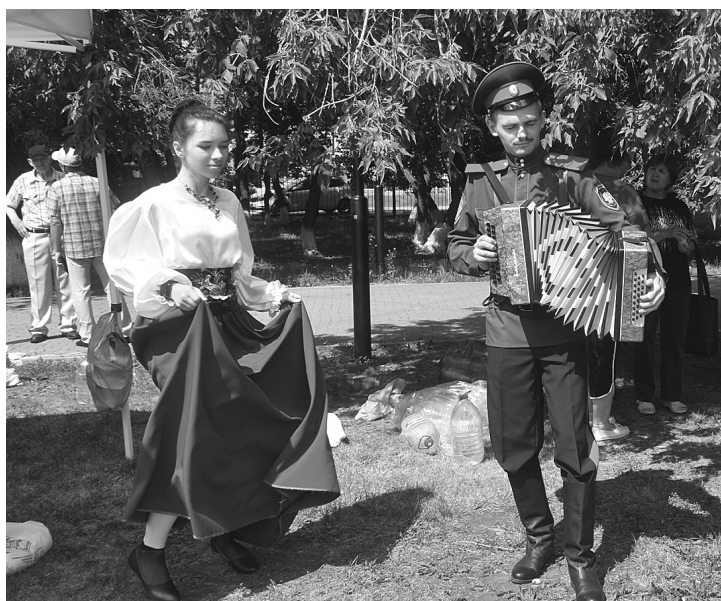
У казахов бердюжан угощали вкусными блюдами, горячей ухой и приглашали к общему веселью с песнями и танцами