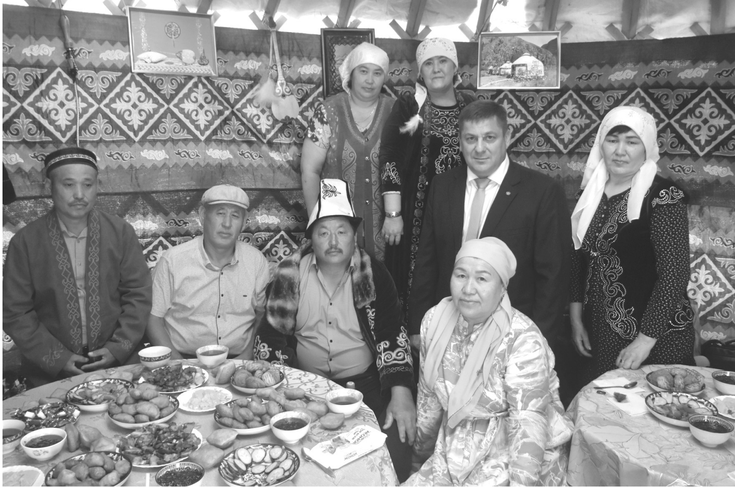
Хлебосольная площадка казахов Бердюжского округа встречала гостей