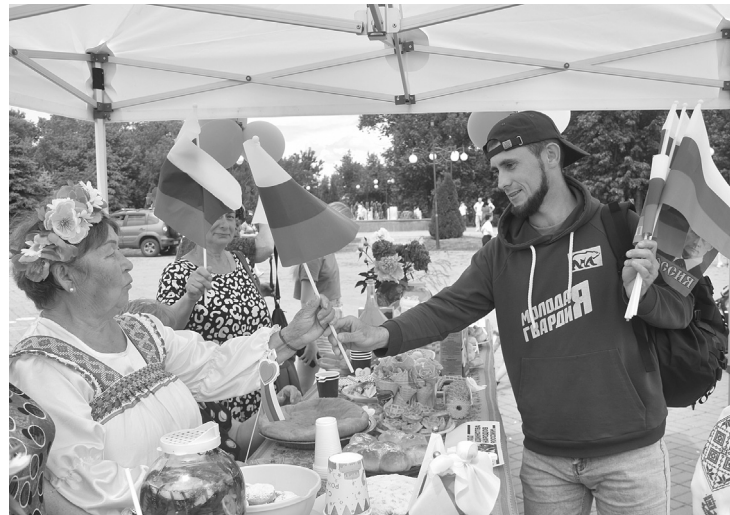
В праздничный день для односельчан работали площадки, где угощали чаем из трав, выпечкой и учили плести венки