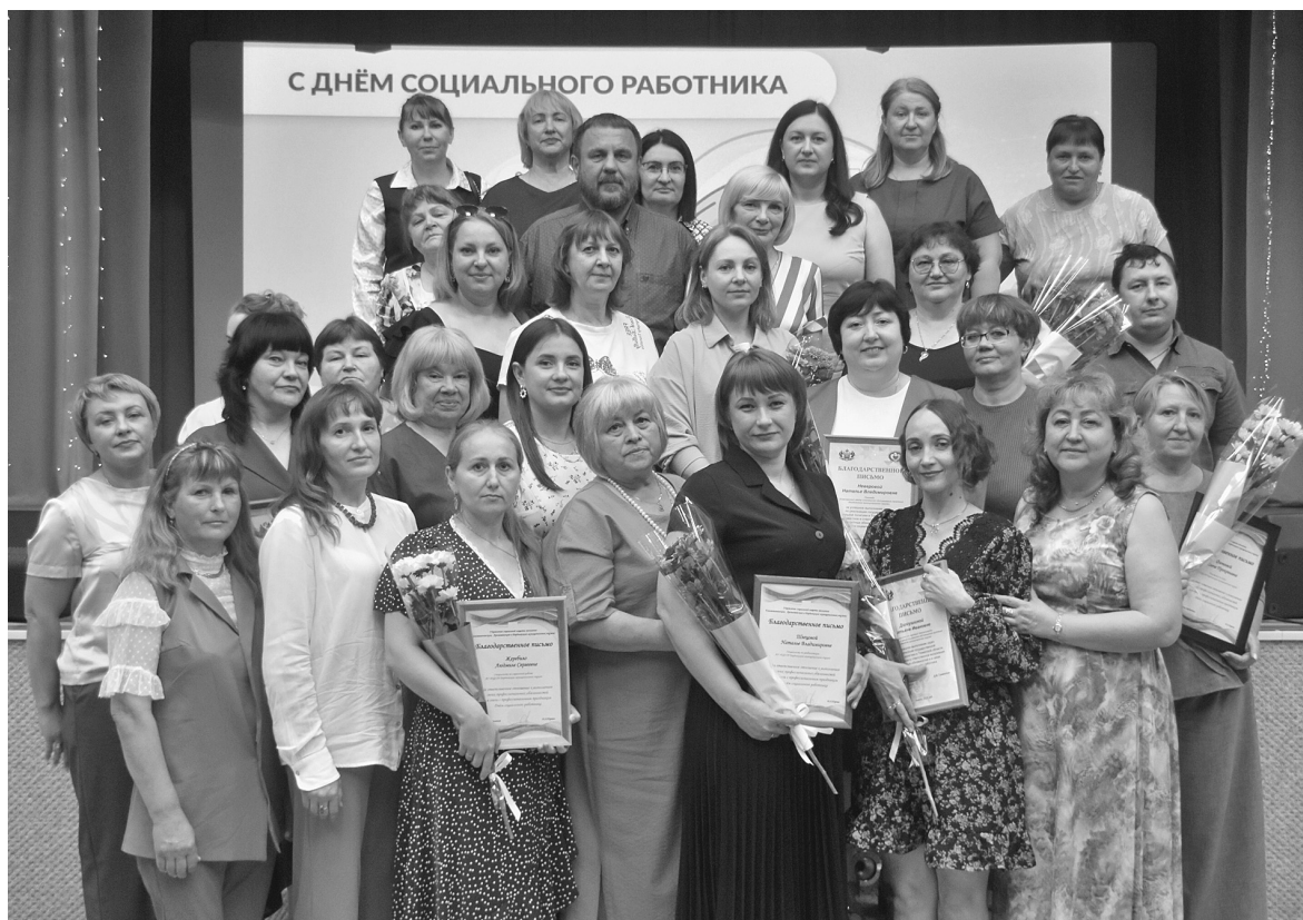
Социальные работники Бердюжского округа принимали поздравления и награды