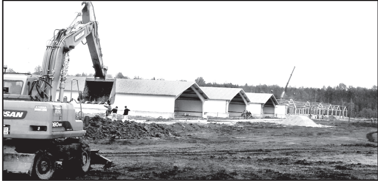
На комплексе по выращиванию индейки полным ходом идут строительные-монтажные работы

О. КОНОВАЛОВА