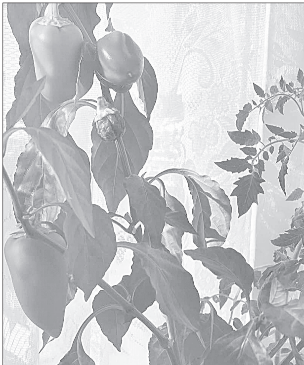
Такому богатому урожаю перцев остаётся только позавидовать. С этого куста их сняли 15 штук