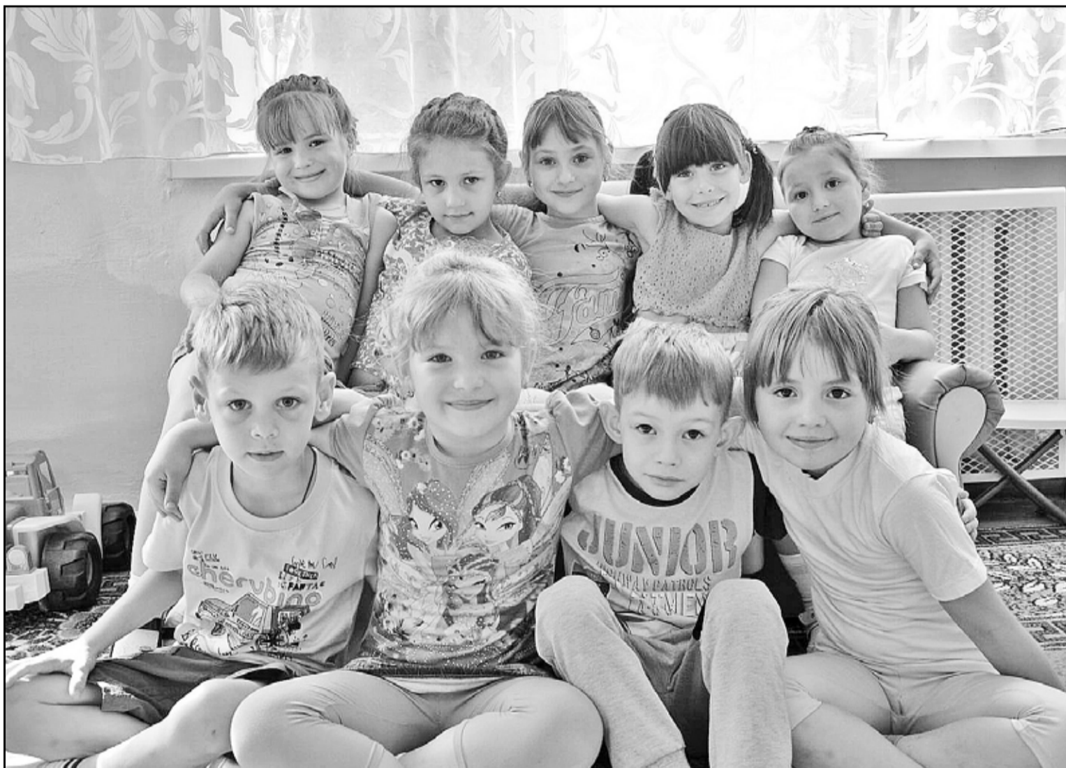
Будущие первоклашки – дружный коллектив воспитанников детского сада № 1. Накануне празднования Дня детей у ребят из подготовительной группы «Дюймовочка» состоялся выпускной

Ежегодно День детей (раньше он назывался День защиты детей) отмечается 1 июня. Не сомневаюсь, что многие взрослые до сих пор помнят то неподдельное чувство детского счастья по поводу того, что начались долгожданные каникулы, что для них организован праздник.