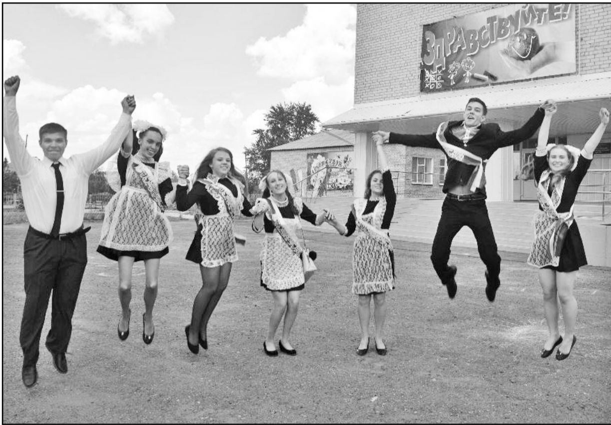
Настроение у девятиклассников – радостное, энергия бьёт через край

Пожалуй, каждый из нас когда-то да восклицал: боже, как быстро бежит время. И я в очередной раз убедилась: не бежит – несётся! Давно ли я присутствовала на выпускном празднике в детском саду у внучки. А вот недавно она пригласила меня на торжественную линейку по случаю последнего звонка после окончания 9-ти классов.