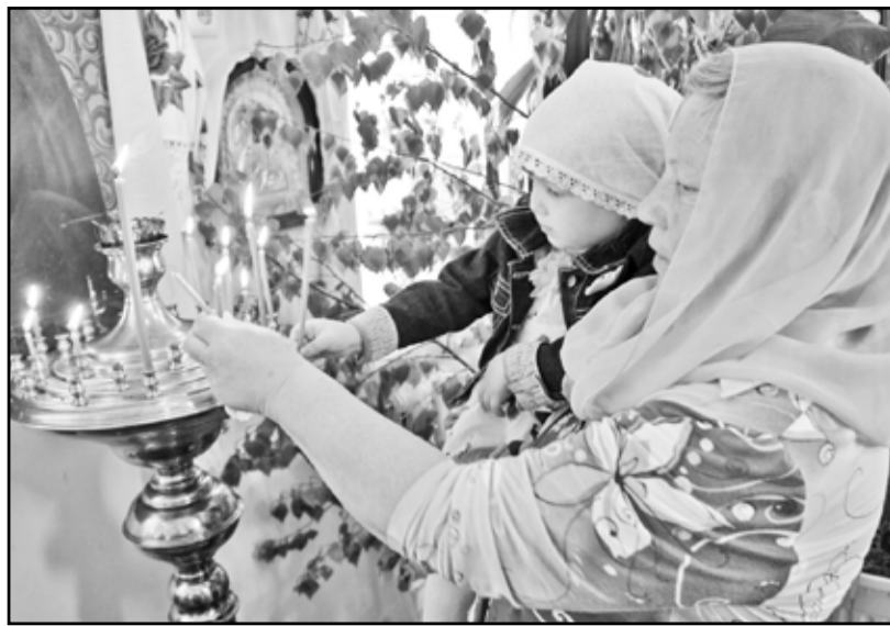
Любая молитва от чистого сердца будет услышана

бы восторжествовала правда. И тут нам с дочерью выпала в руки книга о блаженной Ксении Петербургской. Дочь попросила в молитве святую: «Если ты меня слышишь, присни мне!» В ту же ночь она увидела, как бы сквозь дымку, издали, высокую худую старушку с палочкой и в платочке. Это было как раз в канун Крещения Господня, а на следующий день я заказала молебен святой блаженной Ксении. Через 10 дней моего зятя отпустили домой. Сразу же они с дочкой отправились в храм, исповедовались, причастились и воспедали благодарственные молитвы святой помощнице Ксении».