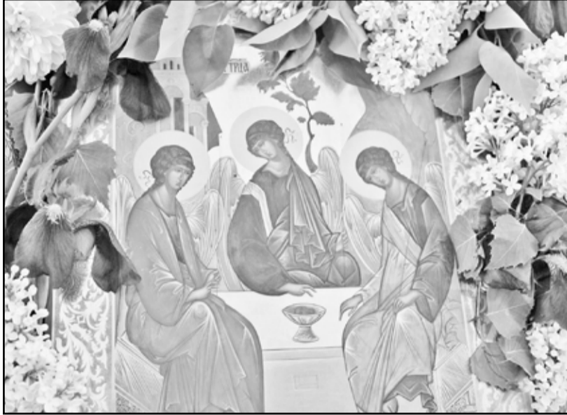
Икона Святой Троицы есть в каждом храме России

давно (в 1988 году), но уже передаются из уст в уста сотни рассказов о её помощи людям. Например, вот что свидетельствует одна женщина: «Мужа моей дочери арестовали прямо на работе. Его обвинили в убийстве. Он, конечно, не был виновен. Начали мы молиться о том, что-