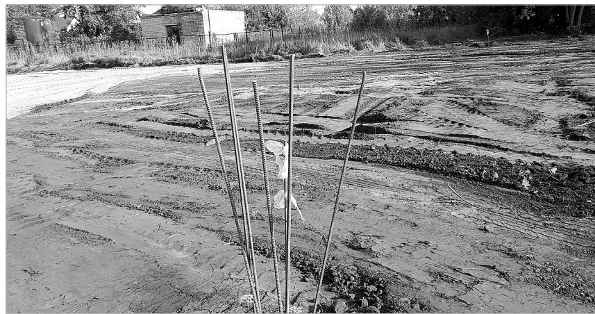
Строительство мини-футбольной площадки с искусственным покрытием на территории Яровской школы завершится к новому учебному году.

Пресс-служба главы района.