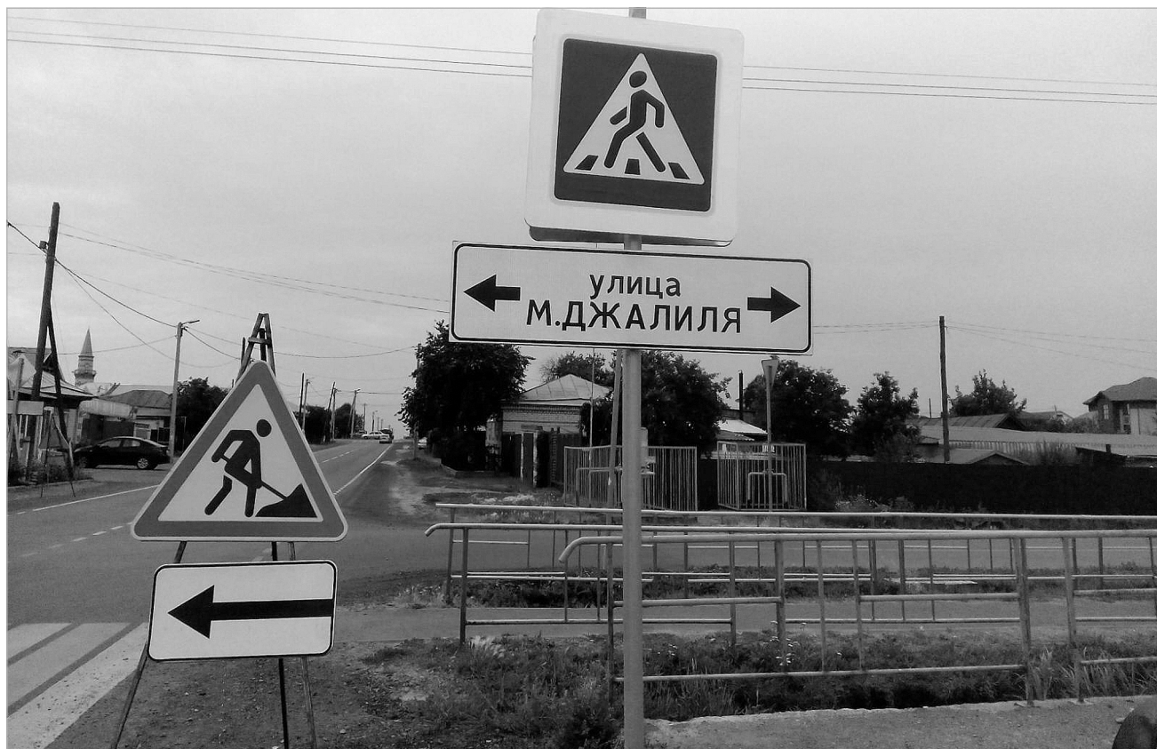
На улице Мусы Джалилия в Ембаево – дорожные работы.