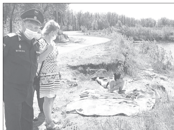
Регулярные рейды инспекторы проводят с конца мая

■ СПРАВКА «ЯЖ». Подразделение ГИМС появилось в городе полтора года назад и обслуживает несколько районов, включая Ялуторовский. Раньше его сотрудники дислоцировались только в Тюмени.