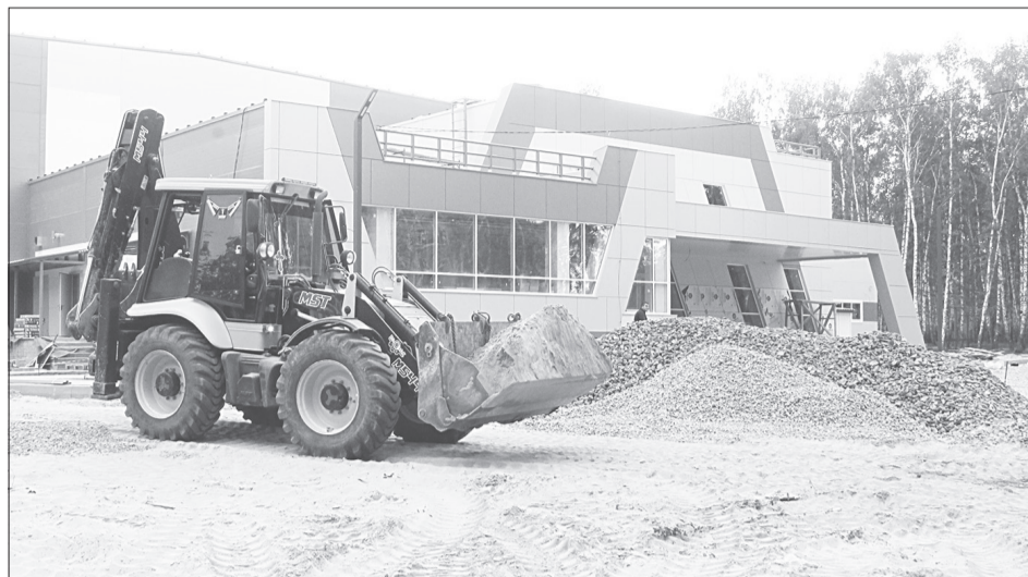
Здесь будут не только асфальт и плитка, но и клумбы с цветами