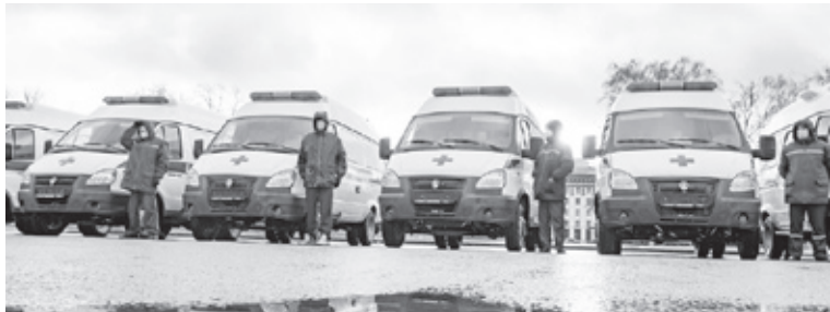
За время пандемии в сфере здравоохранения:

Огромное значение имеет то, что нам в этом драматическом году удалось удержать уровень заработной платы. Причём не только в номинальном, но и в