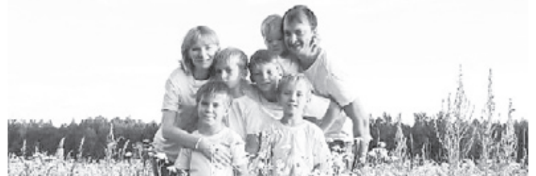
Меры социальной поддержки в 2020 году в Тюменской области:

Дано с сокращениями. Полный текст послания читайте на официальном портале органов государственной власти Тюменской области.