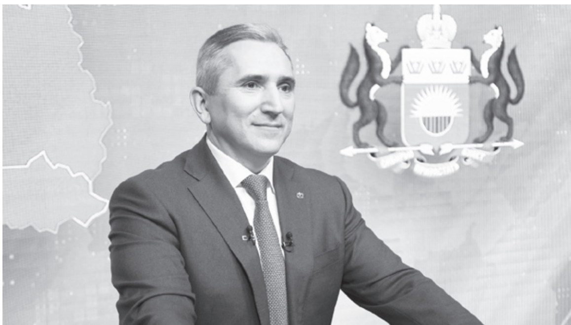
|| Губернатор Тюменской области Александр Моор

Меня спросят: «А как понять, сколько именно свободы возможно, сколько именно ограничений необходимо?» И почему я так уверен, что в Тюмени была найдена и будет сохранена нуж-