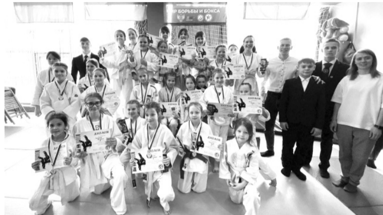
|| Фото из архива спортсменок

Поздравляем наших девочек-дзюдоисток с блестящими результатами и желаем им больших побед и новых достижений в спорте.