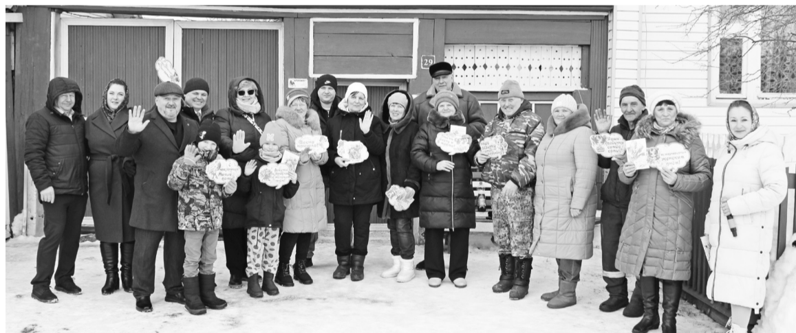
|| Фото из архива ПКК