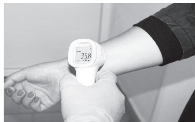
Термометрия – обязательное условие при посещении поликлиники