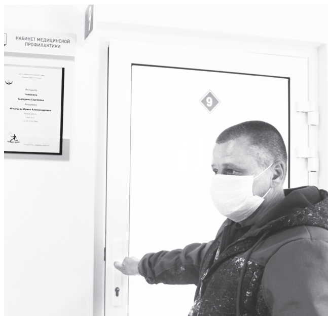
Вакцинироваться – способ обезопасить себя и родных