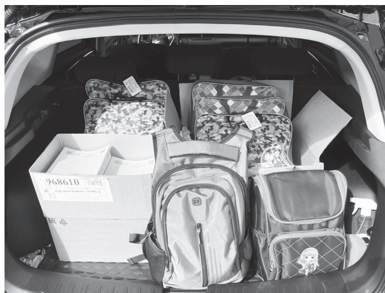
Посылки для детей из ЛНР – школьные принадлежности к началу нового учебного года

Ольга АЛЕКСАНДРОВА