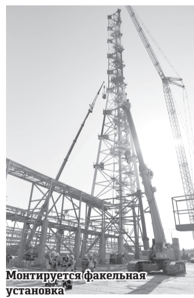
Монтируется факельная установка

Что касается темы сотрудничества с отечественными предприятиями, за 2018 год проведено более 1 100 сделок на поставку стройматериалов и оборудования. Предприятия Тюменского региона поставляют опоры и детали для трубопровода, железобетонные сваи, электротехнические изделия, трансформаторное масло и т.д. В