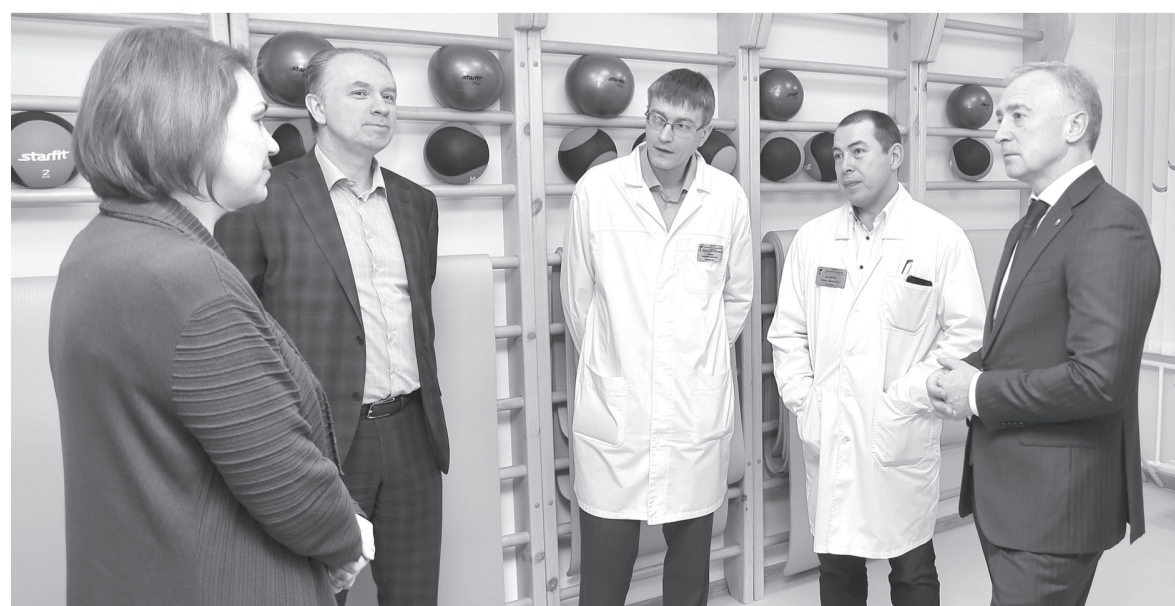
В рамках программы «Тобольск-2020» открыто консультативно-диагностическое отделение в ОБ № 3

– Уже сейчас понятно, что значимость центра архиважная. Хотя полное осознание этого придёт позже. Теперь Тобольск действительно станет впереди всех, здесь можно будет реализовать самые сложные высокотехнологичные задачи, – отметил глава города Владимир Мазур.