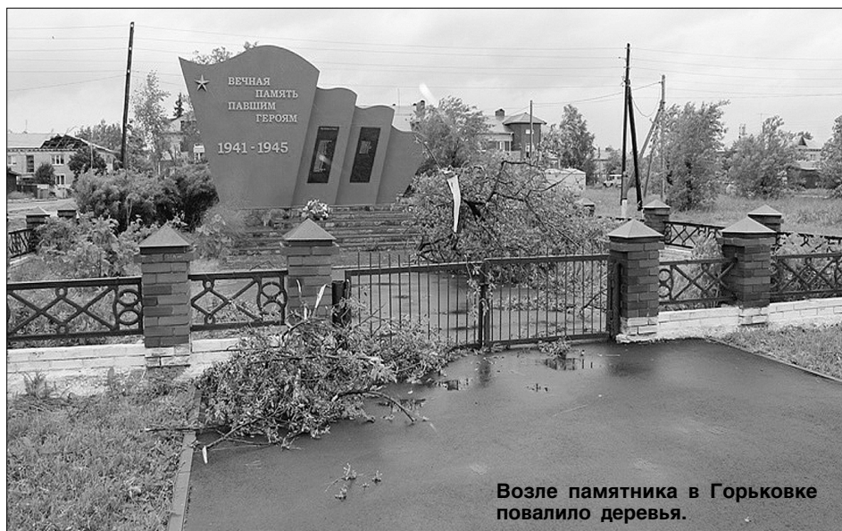
Возле памятника в Горьковке повалило деревья.

В минувшие выходные грозовой штормовой фронт дважды обрушился на территорию Тюменского района. Сильный ветер стал причиной обрыва проводов, завалил ветками дороги. На сегодня ситуация находится под контролем, все службы работают в усиленном режиме.