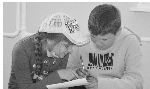
Сообща придём к победе!