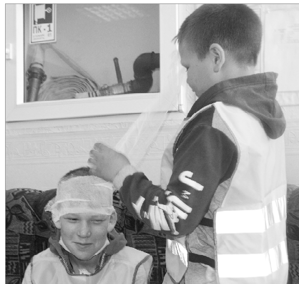
Первую помощь оказывают ребята из Южно-Дубровного