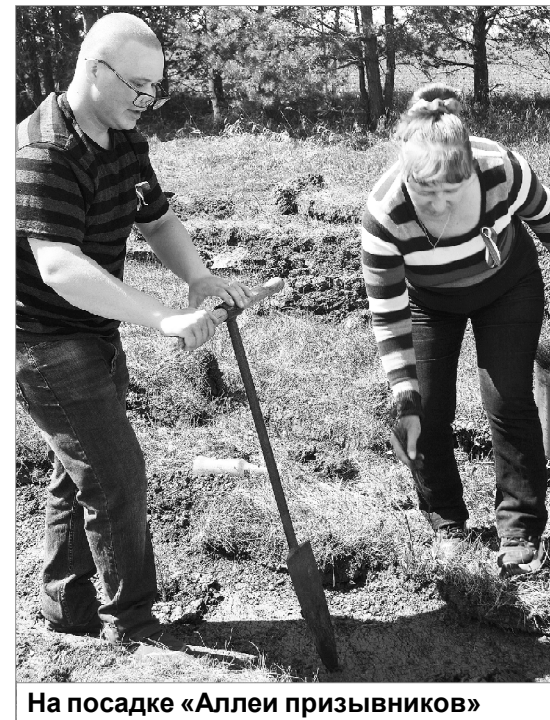
На посадке «Аллеи призывников»

Из выступления военного комиссара юноши узнали много нового о предстоящей службе: о требованиях к гражданам, призываемым на военную службу; ответственности за ук-