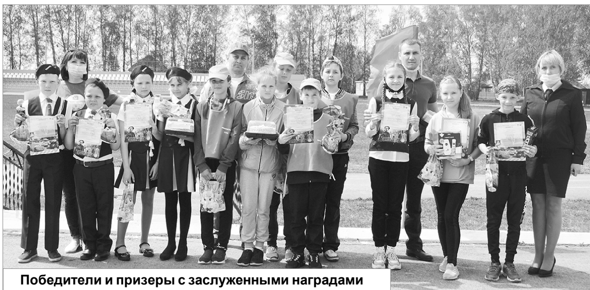
Победители и призеры с заслуженными наградами