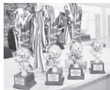
|| Фото из архива ДЮСШ

универсальный игрок Георгий Клейман (Исетское).