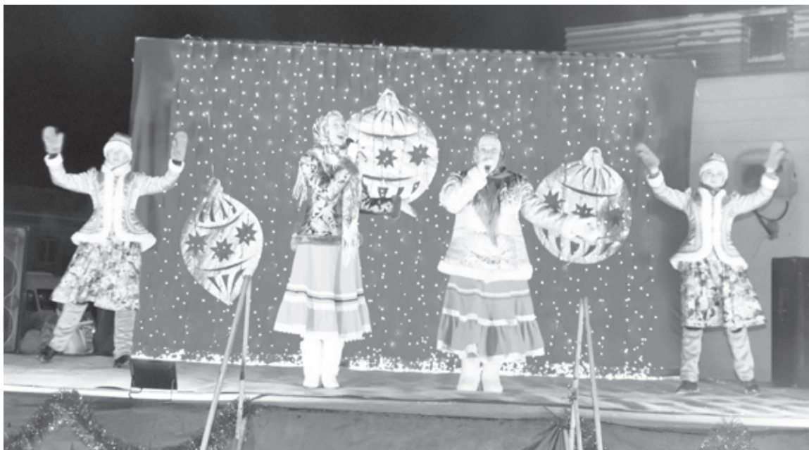
|| Моменты праздника.