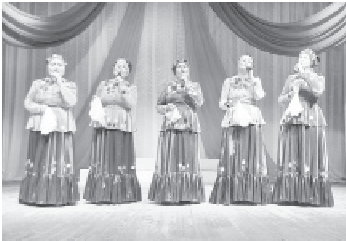
|| Казачьи песни – любимые в репертуаре «Горенки».