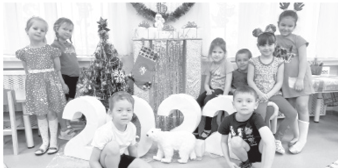
|| Фото из архива детского сада «Радуга»

Иначе и не может быть. Ведь каждый Новый год должен проходить весело, активно, творчески.