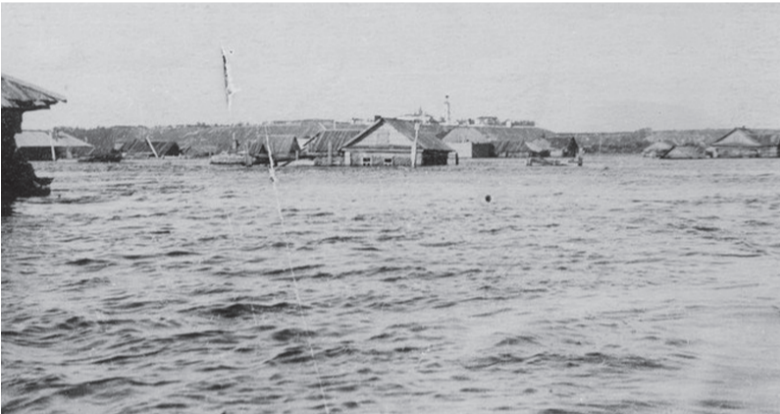
Наводнение 1941г., ул. Ленина

К разливам Иртыша тоболяки и жители прибрежных деревень как-то приспособились. Строили дома