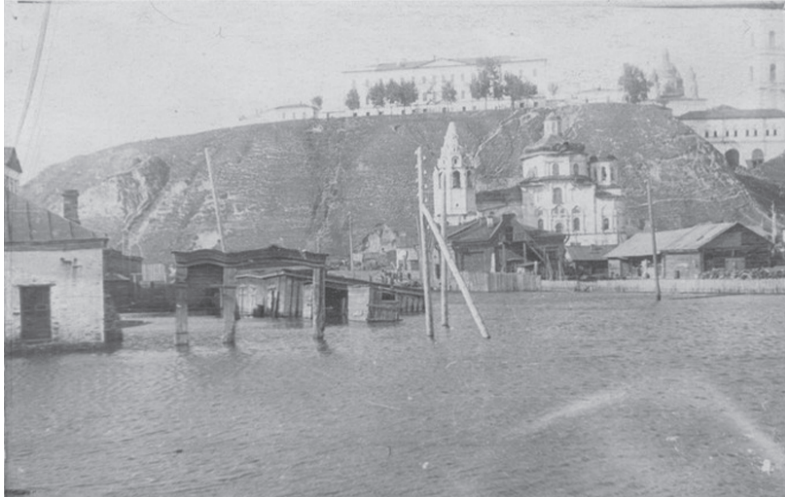
Наводнение в Тобольске в 1941 г. Вид с ул. Семакова на Богоявленскую церковь

В ЭТИ ДНИ ТОБОЛЯКИ С ТРЕВОГОЙ ПОСМАТРИВАЮТ В СТОРОНУ РОДНЫХ РЕК – ГАДАЮТ, ДО КАКОГО УРОВНЯ ПОДНИМУТСЯ ВОДЫ ИРТЫША И ТОБОЛА В ЭТОМ ГОДУ.