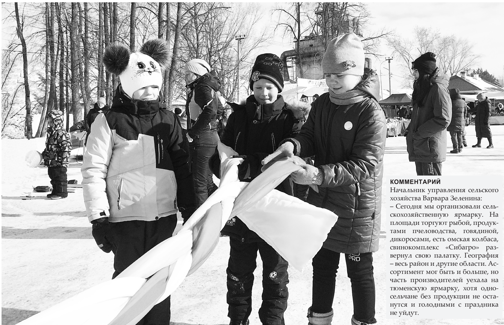
Чтобы отправить Масленицу в добрый путь, нужно сначала заплести ей косу. Ребята это сделали с большим удовольствием.

Нижнетавдинцы встретили весну весельем и добрыми делами