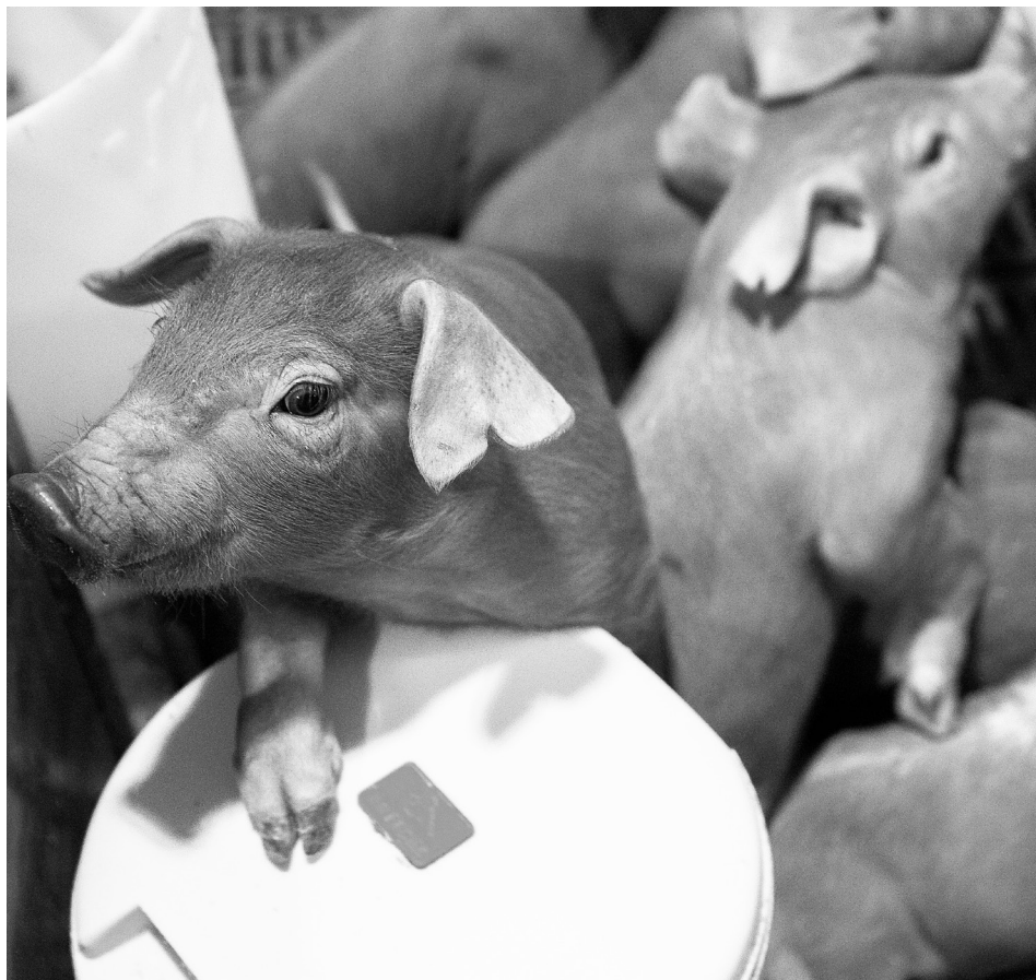
Свиногомплекс «Сибagro» является племенным репродуктором по разведению трёх пород свиней: Ландрас, Крупная белая и Дюрок. На фото из архива свиногомплекса – поросята породы Дюрок.