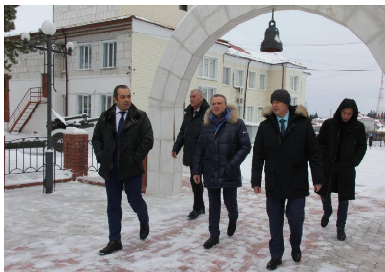
➤ Посещение Мемориала Славы