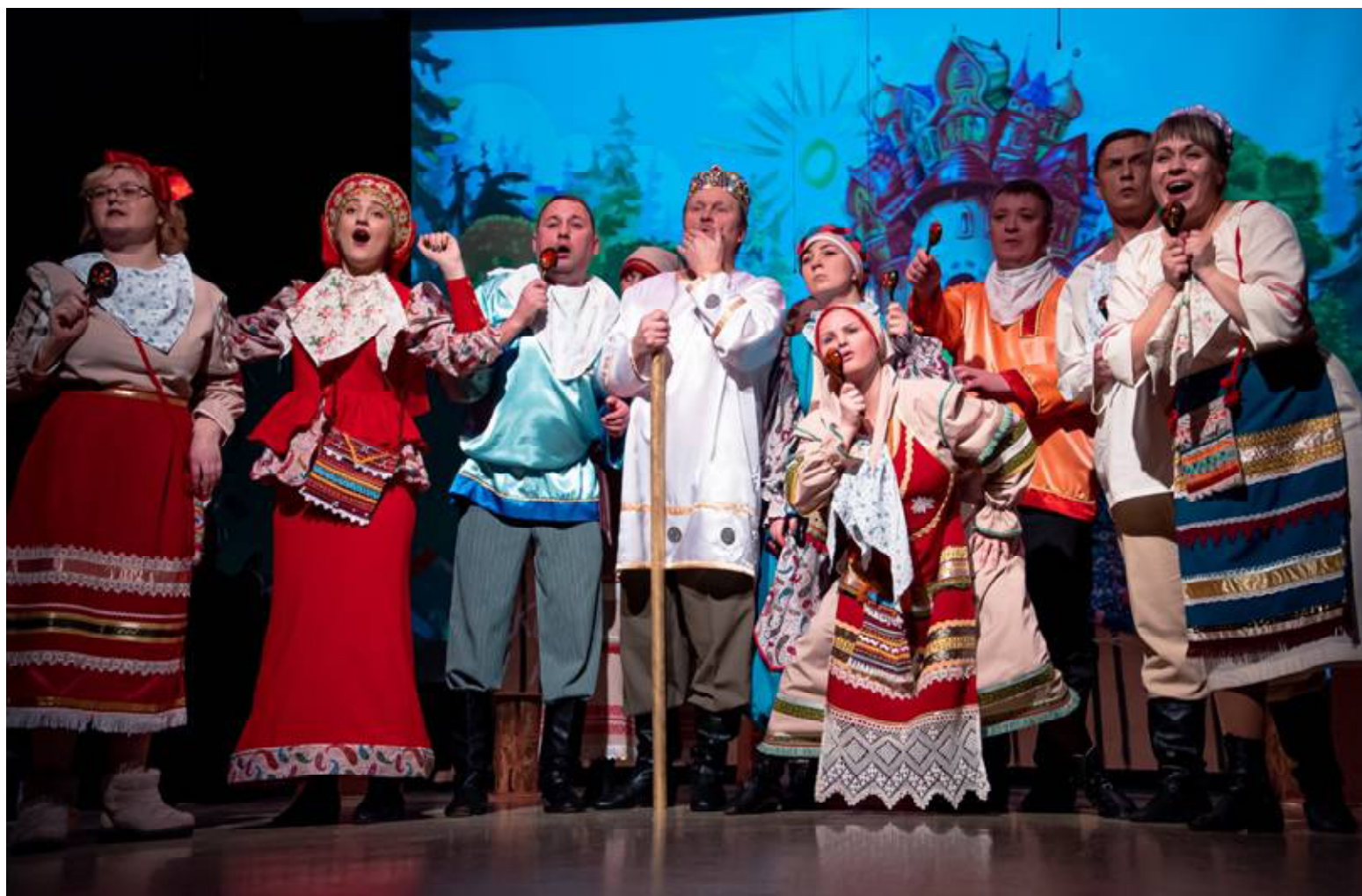
► Моменты комедии «Царевна-Лягушка»