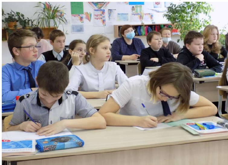
► В «Школе молодого педагога»