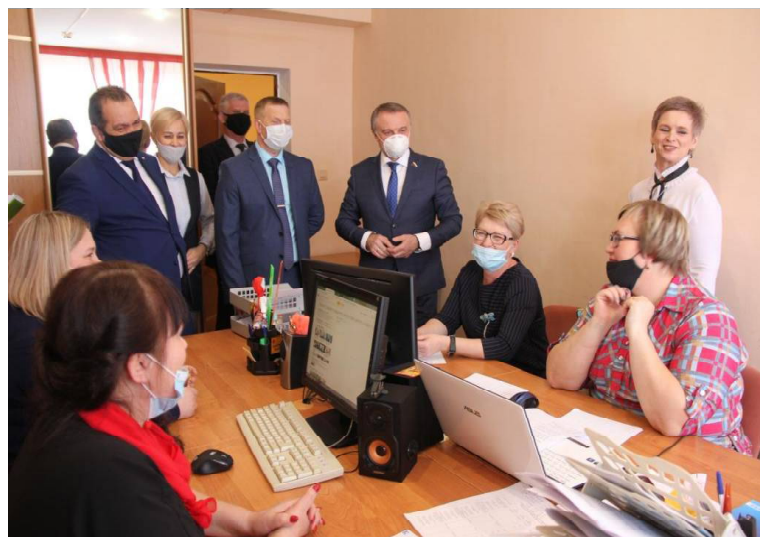
➤ В гостях у ПКУ Викуловского района