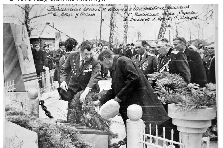
► 9 Мая 1975 г. Викулово. Возложение венков к обелиску