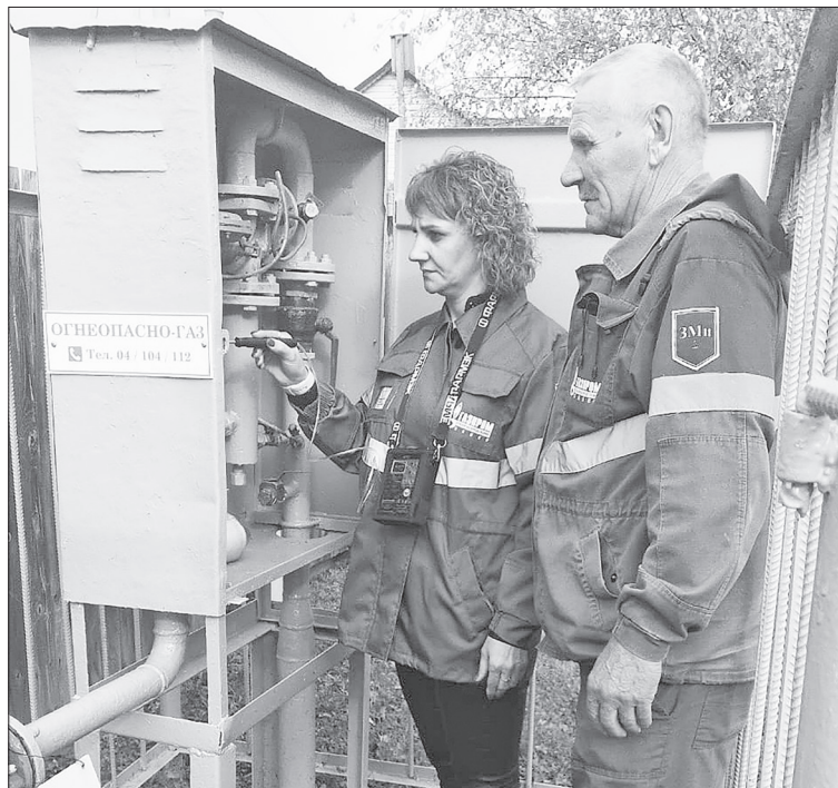
Проверки газового оборудования проходят в установленные сроки.

– Возле Весёлой Гривы уже имеется межпоселковый газопровод, поэтому точка присоединения находится вблизи населённого пункта. Кроме того продолжается газификация в Носырево. Там также построена линейная часть, завершается работа по устройству подводящих газопроводов, и ожидается поставка