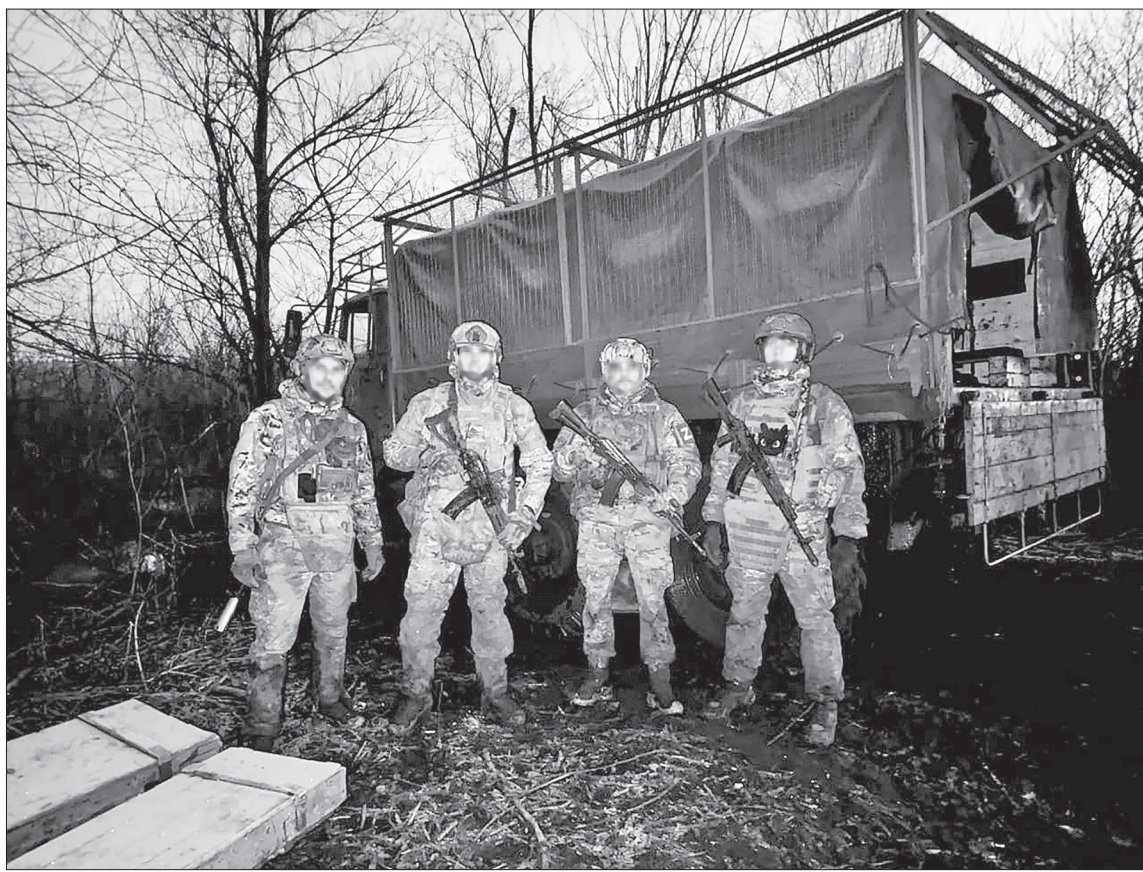
Группа сапёров после выполнения боевого задания.

Заслуженный учитель - о воспитаннике, который стал профессиональным военным и участником СВО