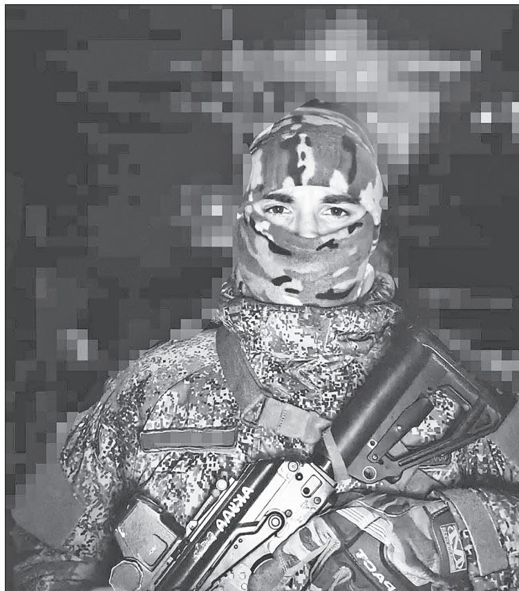
Наш земляк, участник специальной военной операции на Украине, на передовой.

В девятом классе детский коллектив принял участие в конкурсе инсценированной песни. Они нашли песню, которую никто у нас никогда раньше не ставил. «Фронтвой санбат у лесных дорог был прокурен и убит тоскою. Но сказал солдат, что лежал без