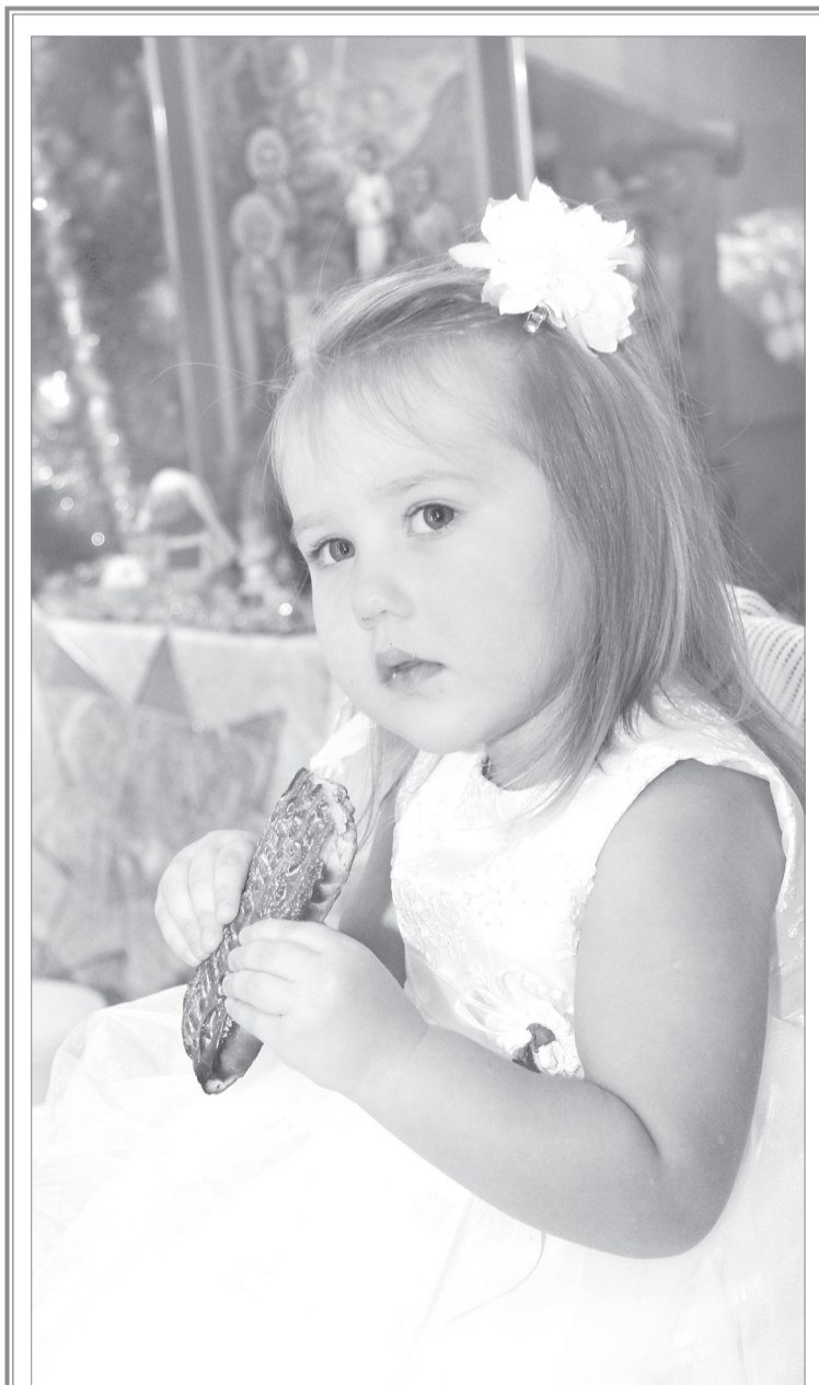
В ожидании рождественского чуда

Наверное, самым счастливым Был тот удивительный год, Когда молодой и красивый Я жил без тревог и хлопот. А рядом был город желанный, Где мама родная жила. И сына она непрестанно Домой вечерами ждала.