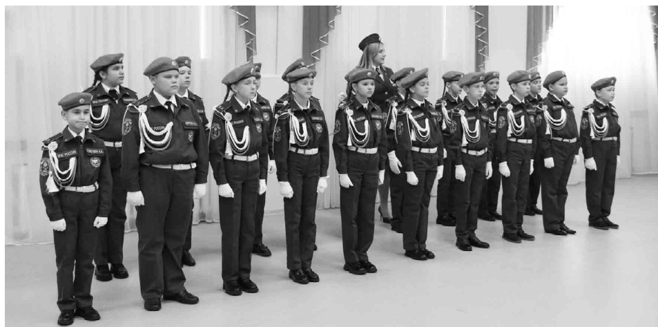
Кадетский класс МЧС к принятию клятвы готов

Юные воспитанники профильного класса МЧС поклялись служить на благо Отечества