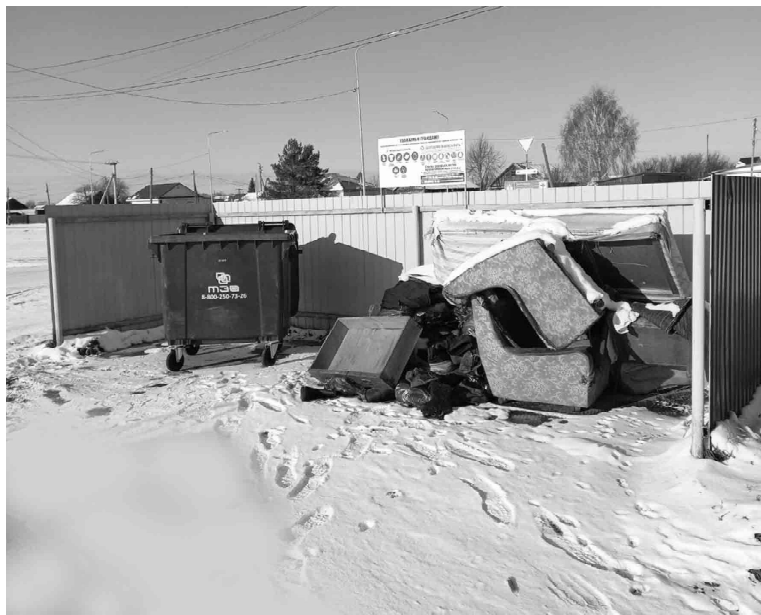
Старой мебели не должно быть на площадке для бытового мусора