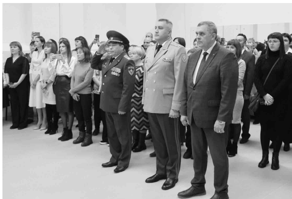
Поздравить юных спасателей пришли почетные гости