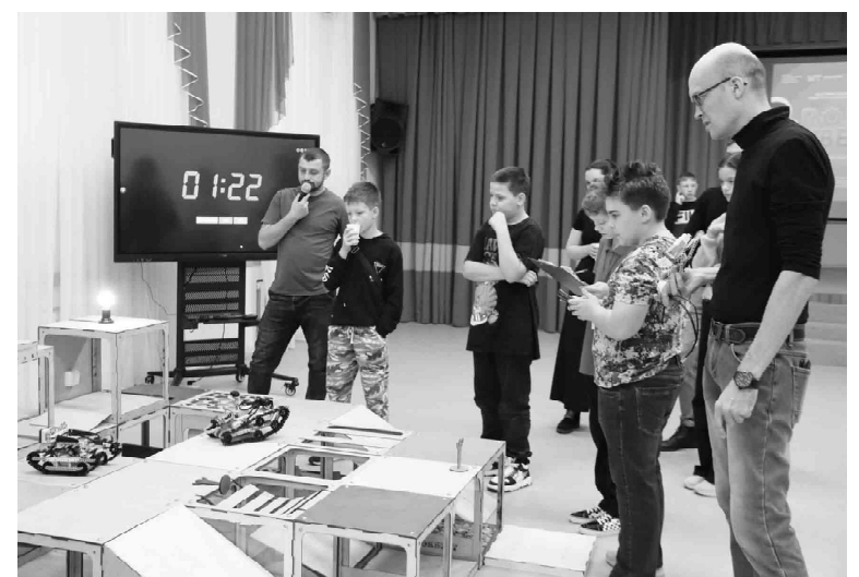
Умные машины проходят полосу препятствий