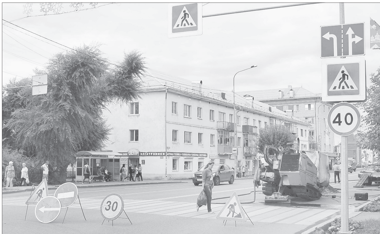
Плановые работы по замене старых коллекторов на новые в Ялutorовске ведутся каждый год

■ СПРАВКА «ЯЖ». 5,3 млн руб. - стоимость двух роторных воздухоувлажнителей ВР-6/1 GM CCM 44.5/0.7-75, производительность каждой - до 2500 м³/час.