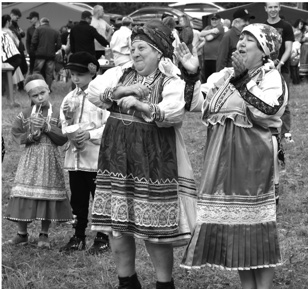
Калиновцы широко и массово отпраздновали день рождения своего села / ФОТО: АВТОР.

Праздники. Вековой юбилей мордовского села отметили в Сорокинском районе