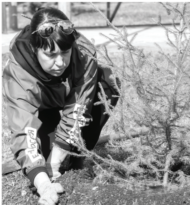
Посадка деревьев стала доброй традицией в Ишиме. Волонтеры с удовольствием принимают участие в этих мероприятиях. Больше зелени – чище воздух, здоровее планета.

Активны в благоустройстве родного города ветераны. Они – неперенные участники всех