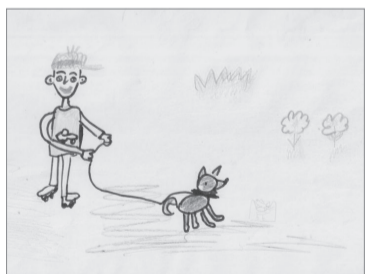
Максим Раев, 7 лет