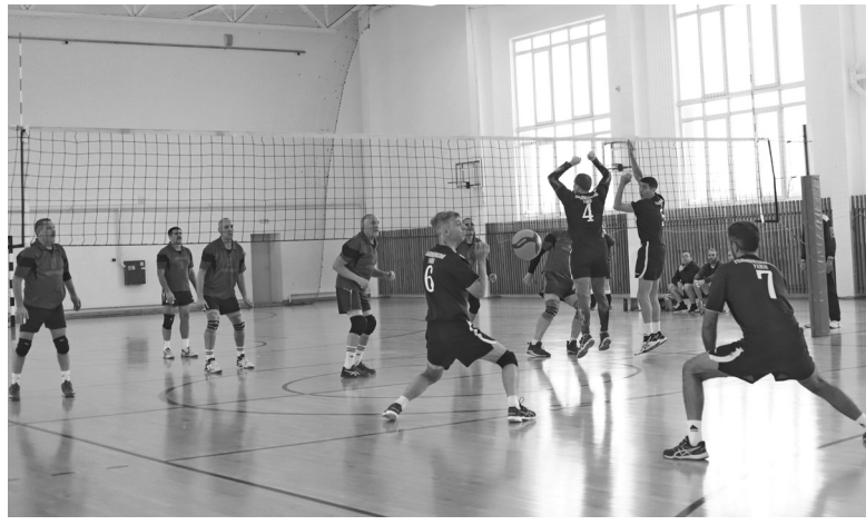
Атакующие мячи тюменских чемпионов голышмановцы принимали достойно

Некоторые спортсмены начали свой волейбольный путь уже будучи взрослыми, а кто-то вырос в спортивной семье и играет всю жизнь.