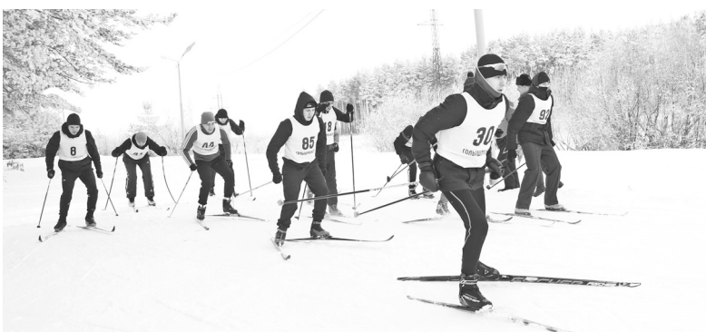
Лыжные гонки показали, что спасатели поддерживают хорошую физическую форму в любое время года

Стартовала III Спартакиада Главного управления МЧС России по Тюменской области. В зачёт этих соревнований прошли лыжные гонки в зоне отдыха «Сосновый бор» посёлка Голышманово.