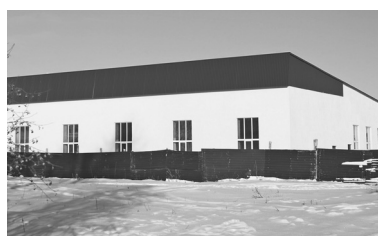
В спортивном комплексе в райцентре будет бассейн, фитнес- и спортзалы, в каждой раздевалке предусмотрены душевая и санузел

– Наиболее востребованными остаются инвестиционные займы