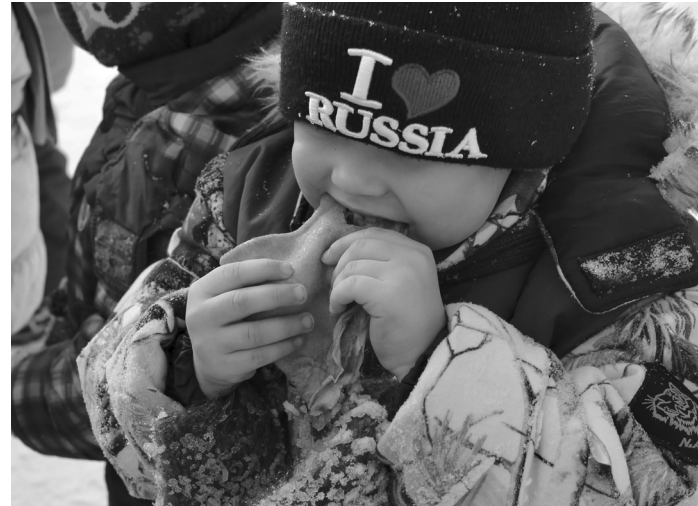
Угощение блинами – обычно самый запоминающийся момент для дошколят на праздновании Масленицы

Блины для россиян – не только символ масленого застолья, но и любимое повседневное блюдо. В нашей кухне они появились не позднее IX века.