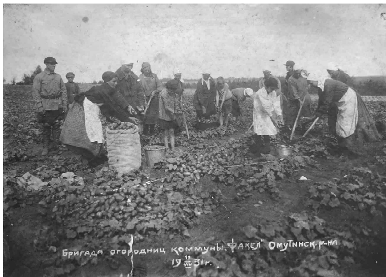
Омутинские жители трудятся на сборе урожая

Анжелика ПАЙВИНА