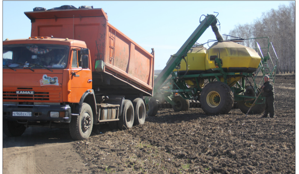
• Первыми к посеву однолетних трав приступили в Юрминском отделении ООО СП «Гольшмановское».