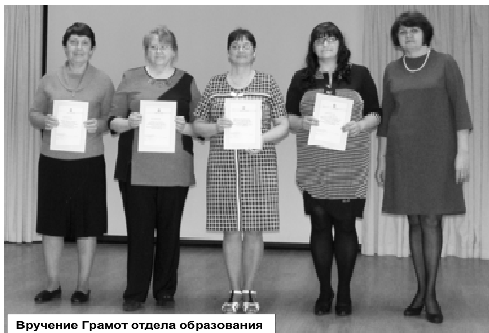
Вручение Грамот отдела образования