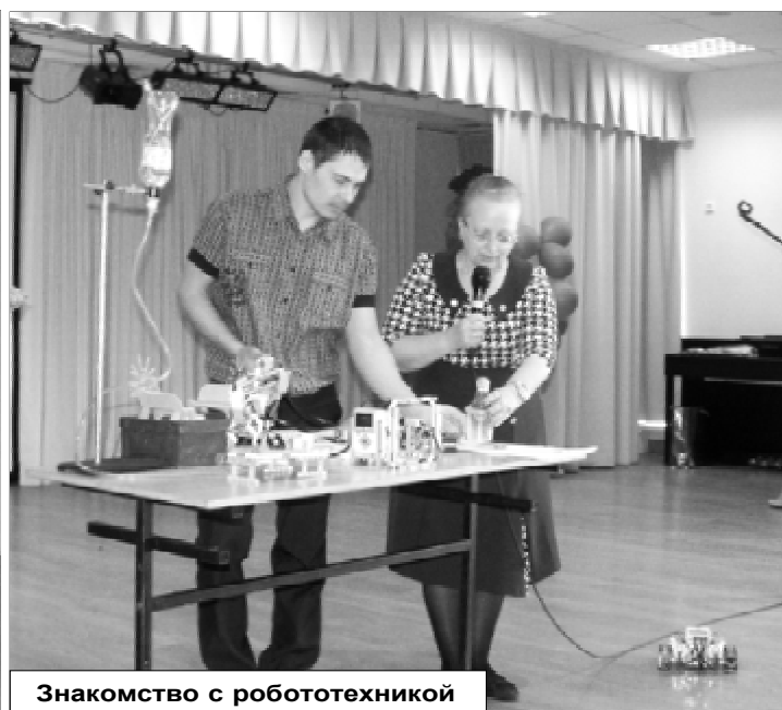
Знакомство с робототехникой