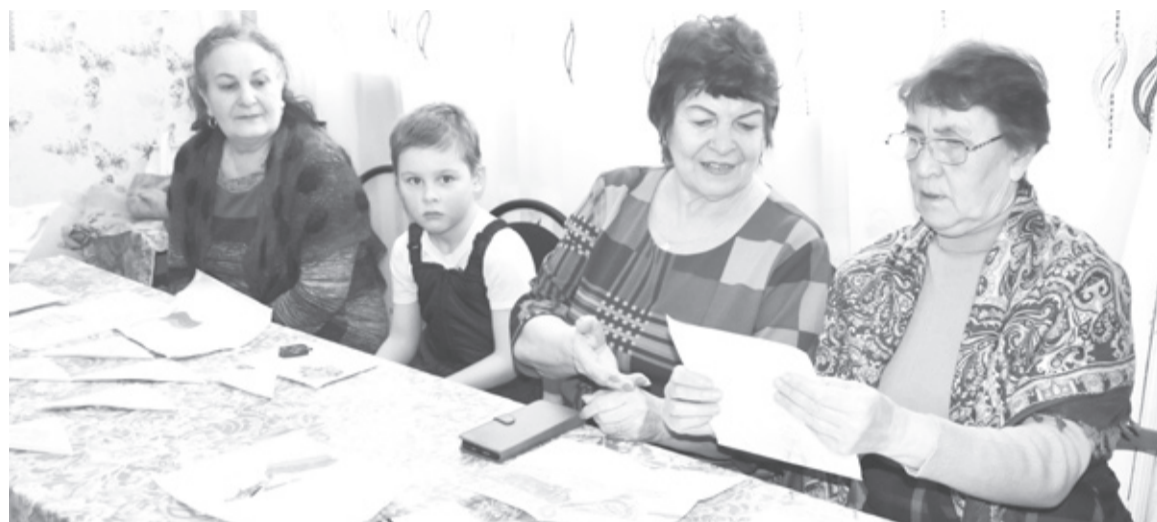
|| Фото автора

А ещё дети желают, чтобы над нашими головами было мирное небо, а военная техника стояла в музеях и на площадях как экспонаты, а не использовалась по назначению.