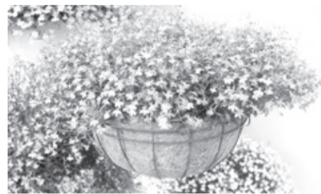
|| Фото с сайта flo.discus-club.ru

обрезают несколько раз, оставляя над поверхностью земли 5 сантиметров стеблей, наиболее важно сделать это после первого цветения, которое заканчивается в середине лета. Через две недели начинается вторая волна цветения, которая в большинстве случаев более буйная, чем первая. Поливайте, рыхлите, подкармливайте. Красоты вам на усадьбе!