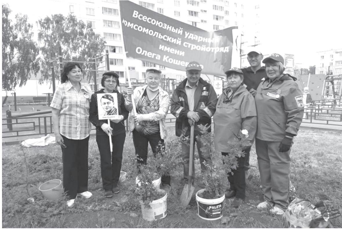
По-прежнему комсомольцы, по-прежнему в строю

Ехали в Сибирь за романтикой, а находили здесь вторую малую родину, своё любимое дело, утвердились как профессионалы, играли комсомольские свадьбы,