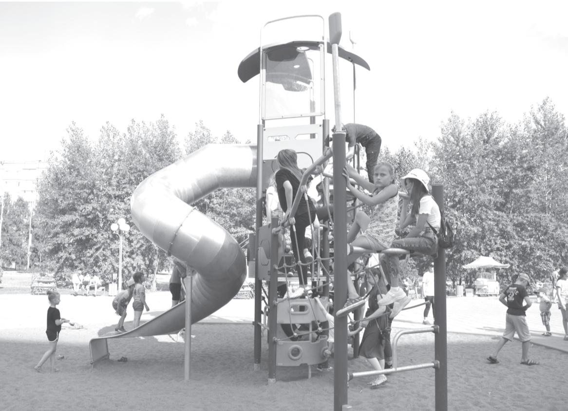
Экипаж космического корабля к взлёту готов