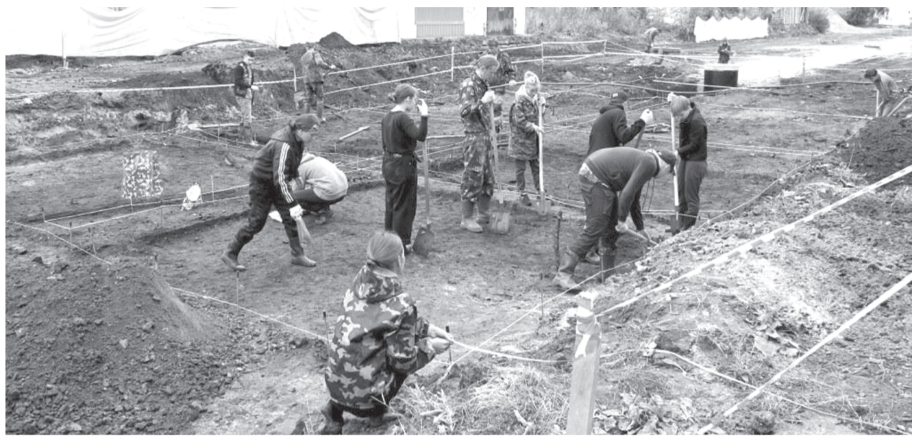
Археологические раскопки в самом разгаре

Завершив осмотр исторической территории, тобольские учёные крайне осторожно озвучили прогноз о возможных результатах текущих археологических исследований на улице Мира и Базарной площади, поскольку в процессе реконструкции данных исторических объектов определённый объём культурного слоя всё же подвергнется разрушению.