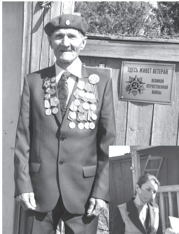
лиčka с надписью «Здесь живёт ветеран», изготовленная в типографии центра реали-

А главным подарком для Ишимцева стала таб-