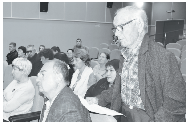
Упоровцы активно участвовали в работе схода.

Говоря о развитии сельского хозяйства, руководитель района обратил внимание на снижение поголовья коров не только на предприятиях (на 1000 голов),