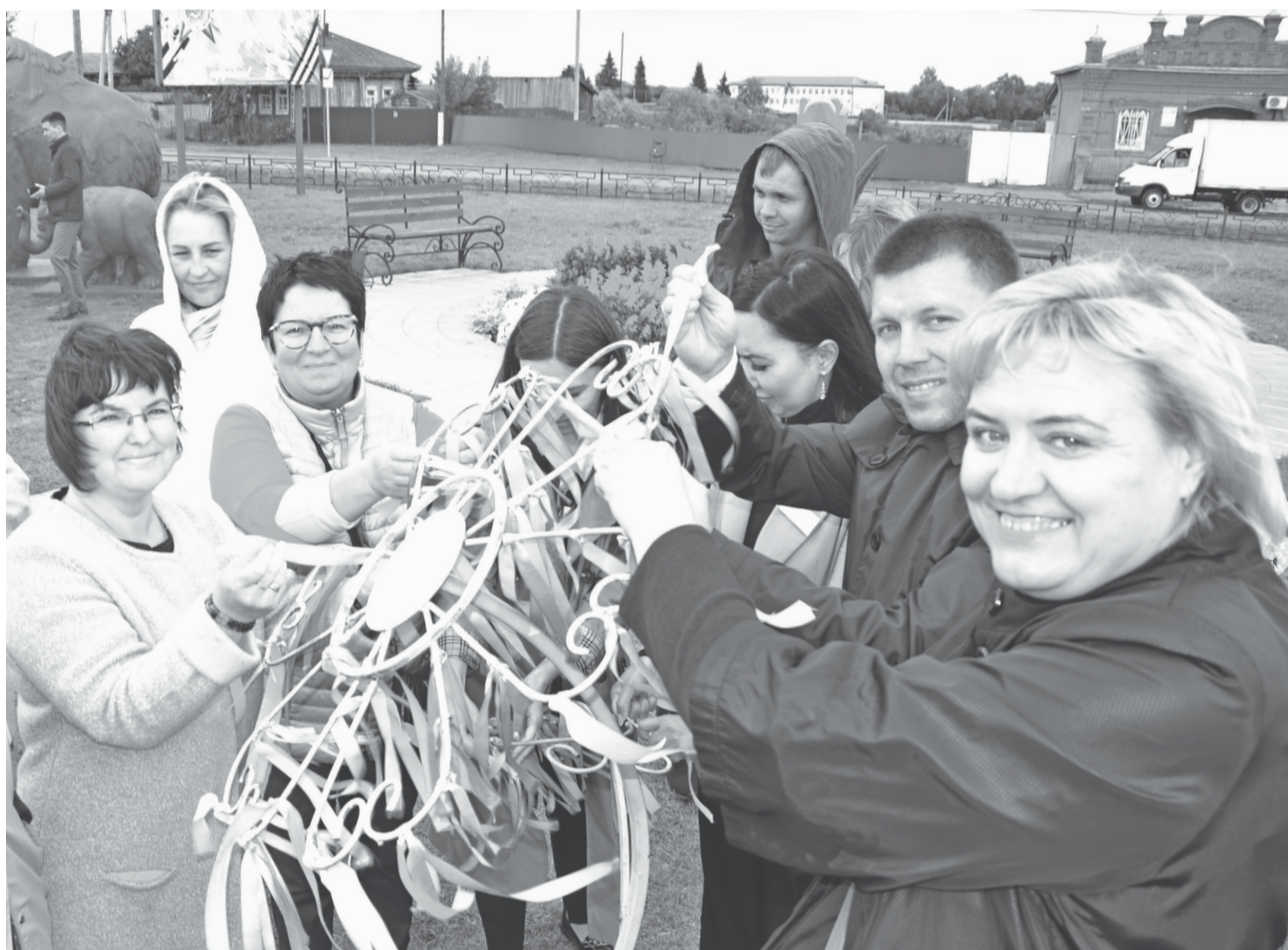
Гости упоровской земли повязали на ромашку ленты на счастье в семейной жизни.