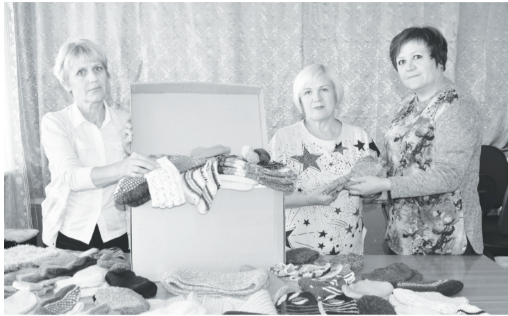
Волонтеры пакуют очередную посылку для жителей Донецка и Луганска.