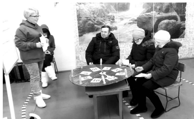
➤ Зрители играют в «Поле чудес», с. Ачимово