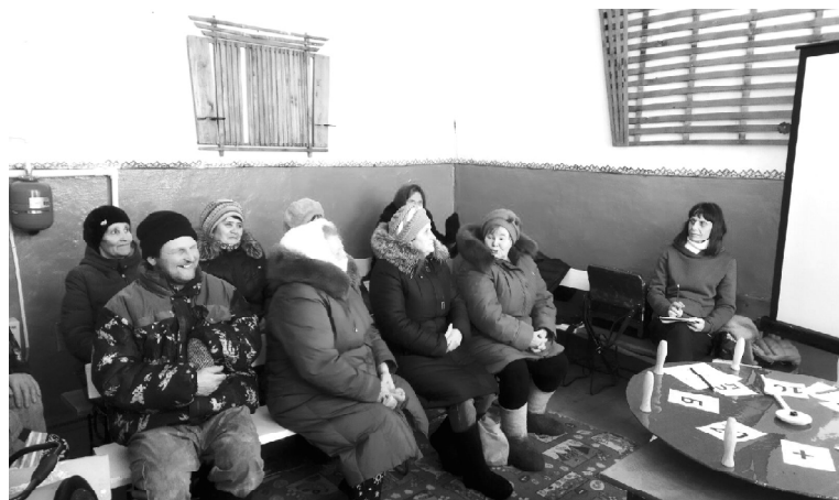
➤ Во время мероприятия в Долгушино

Отдохнув в новогодние каникулы и соскучившись по своим любимым зрителям, работники Передвижного клубного учреждения стали думать, как их развлечь и удивить. И вот было решено начать новый сезон с интеллектуально-развлекательной программы «Поле чудес». Тема для проведения игры была выбрана необычная – «Как говорили в старину». С 24 января весёлая бригада начала своё путешествие по малым деревням нашего района. Зрители были рады встрече.