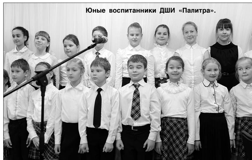
Юные воспитанники ДШИ «Палитра».

здание, верой и правдой служившее искусству, со временем обветшало.