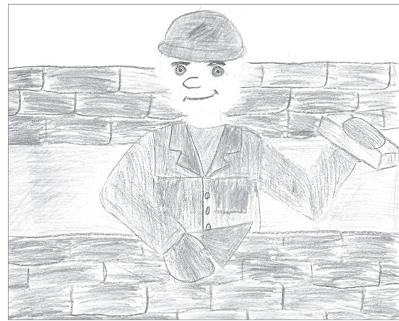
Макар Тремясов, 6 лет