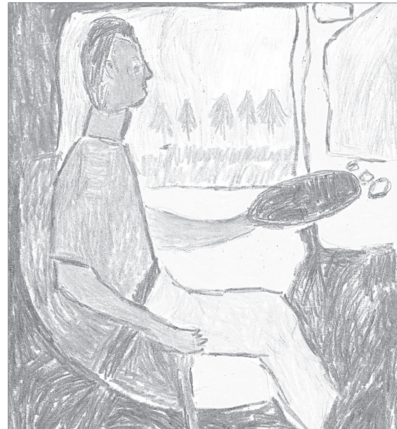
Катя Смирнова, 5 лет